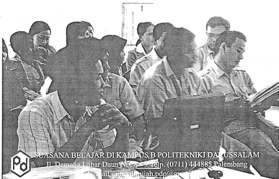
SUASANA BELAJAR DI KAMPUS B POLITEKNIKI DARUSSALAM II. Demang Labar Daun No. 3 Telp. (0711) 444885 Palembang Email: jurnalilmiah.pdp@pdpdarsa.ac.id