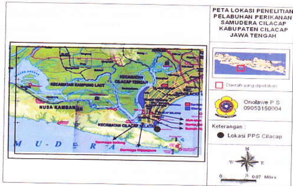
Gambar 1 Lokasi Pelabuhan Perikanan Samudera Cilacap.