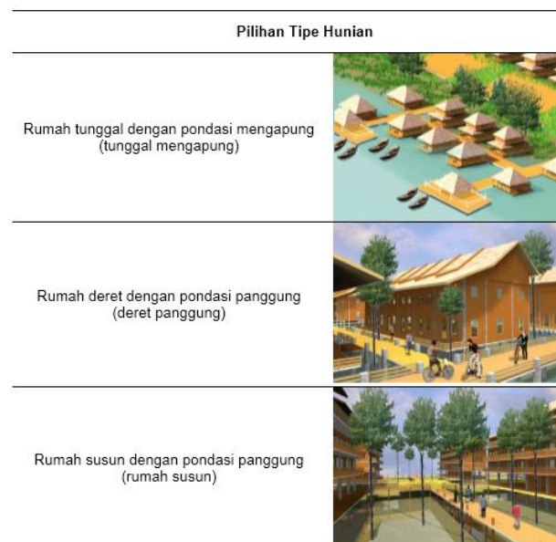
Gambar 2. Pilihan Tipe Rumah

Kriteria penilaiannya disusun melalui elaborasi literatur yang terkait dengan pembangunan di lahan basah. Pakar menilai kesesuaian pilihan tipe massa, terhadap kriteria-kriteria tersebut. Terdapat tiga pilihan tipe rumah, yaitu rumah tunggal dengan pondasi mengenai ketiga tipe rumah maka kuisioner dilengkapi dengan ilustrasi yang menjelaskan perbedaan ketiga tipe (lihat Gambar 2).