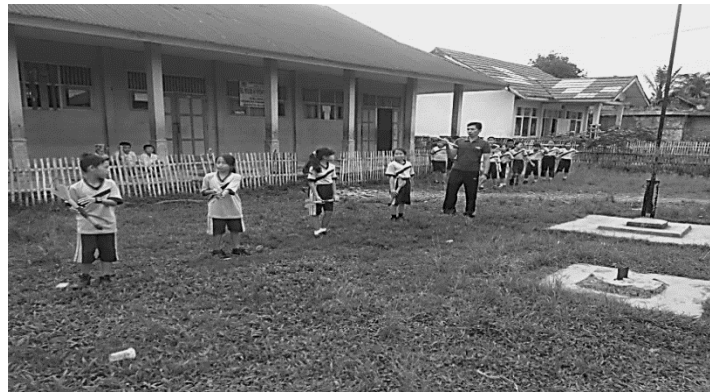
Gambar 1.1. Hasil observasi di Sekolah Dasar negeri 65 Rejang Lebong

Perkembangan anak tingkat sekolah dasar menjadi perhatian penting karena pada tahap ini pertumbuhan fisik baik secara langsung maupun tidak langsung akan mempengaruhi motivasi peserta didik untuk belajar. Perkembangan fisik dipengaruhi oleh keterampilan gerak dimana bagi siapa saja yang mampu mengoptimalkan gerak maka akan semakin baik memaksimalkan fungsi penginderaan sehingga dapat mengimplemintasikan dari hasil penginderaan untuk menerapkan pengalaman berupa ilmu yang diberikan dan dapat diserap dengan baik serta optimal.