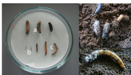
Gambar 1. Gejala serangan jamur entomopatogen pada serangga. (a) ulat bambu, (b) P. xylostella , dan (c) T. monilitor .