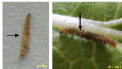
Gambar 3. Gejala serangan jamur entomopatogen pada larva P. xylostella .

Variasi kerapatan dan viabilitas spora dari isolat yang diuji menunjukkan daerah asal isolat dan larva yang diisolasi berbeda. Faktor yang dapat menyebabkan perbedaan kerapatan dan viabilitas spora diantaranya media biakan (Herlinda et al. , 2006), suhu dan kelembaban (Sheroze et al. , 2003; Suharto et al. , 1998; Prayogo et al. , 2005) serta faktor genetik (Nuraida & Hasyim, 2009). Suhu rata-rata selama penelitian adalah 29,48°C dan kelembaban nisbi 89,55%. Suhu dan kelembaban tersebut cukup baik untuk pertumbuhan jamur entomopatogen. Menurut Sheroze et al. , (2003)