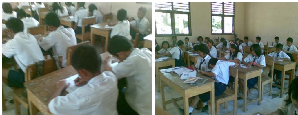
Gambar 2: Siswa melaksanakan tes