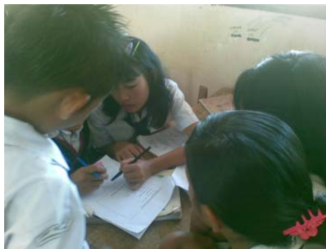
Gambar 1: Kegiatan siswa dalam Cooperative Learning

Dari hasil observasi yang dilakukan selama proses pembelajaran pada siklus I yang dilakukan oleh observer diperoleh: