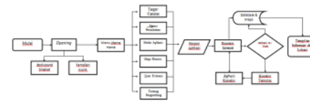
Gambar 1. Flowchart Pengembangan Aplikasi Mobile Learning

Secara berurutan tahapan flowchart diawali dengan membuka aplikasi Mobile Learning Asia Tenggara ( start ) kemudian aplikasi akan merespon dengan memunculkan pembuka ( opening ) yang akan menampilkan gambar ikon aplikasi dan suara latar aplikasi, selanjutnya aplikasi akan memproses menu yang akan ditampilkan seperti sub menu target capaian, sub menu materi perkuliahan, sub menu media aplikasi, sub menu quiz dan sub menu tentang pengembang. Setiap sub menu akan memberikan respon dengan menampilkan isi sub materi.