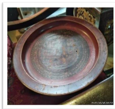
Gambar 1 : Kerajinan Lakuer dahulu

Kerajinan ini mempunyai berbagai macam bentuk mulai dari tempat sirih, meja, bahkan hiasan dinding dapat pula dikatakan seluruh prabotan kerajinan yang ada di Palembang menggunakan corak lukisan lakuer (wawancara dengan Ibu Vita 25/08/2021).