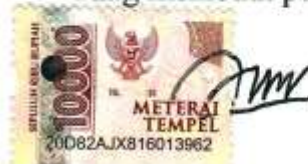
Fathur Al Athur