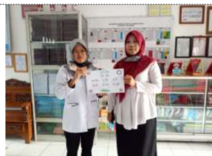
Gambar 5. Hasil Media Pembelajaran Tematik Kurikulum 2013 yang dibuat oleh peserta

Dalam pelaksanaannya, dengan dukungan kepala sekolah SD Negeri 2 Palembang yang juga ikut serta dalam pelatihan ini, juga terlihat para guru sebagai peserta menerima dengan positif materi yang diberikan narasumber. Hal ini membuka wawasan guru dan kesadaran guru bahwa pentingnya pemahaman mengenai media pembelajaran tematik pada