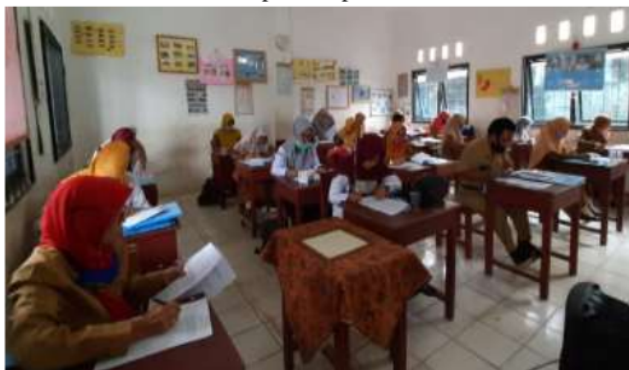
Gambar 1. Peserta Pelatihan

Pelaksanaan pembinaan dan pelatihan ini dalam waktu 8 (delapan) bulan terhitung dari mulai disusunnya proposal kegiatan Pengabdian kepada Masyarakat sampai dengan penyusunan laporan. Pada tahun 2020 ini fokus kajian mengenai media pembelajaran tematik kurikulum 2013 yang dilaksanakan dalam suatu tindakan pembinaan dan pelatihan. Kegiatan Pengabdian ini dilaksanakan di SD Negeri 2 Palembang sebagai sekolah mitra PGSD FKIP Universitas Sriwijaya. Kegiatan tatap muka dilaksanakan pada 11 Agustus 2020 dengan memperhatikan protokol kesehatan di masa Pandemi Covid 19 ini, kemudian dilanjutkan tanggal 12 dan 13 Agustus pelaksanaan terbimbing jarak jauh/ online yang diikuti oleh 20 orang peserta guru. Berikut dokumentasi peserta pelatihan.