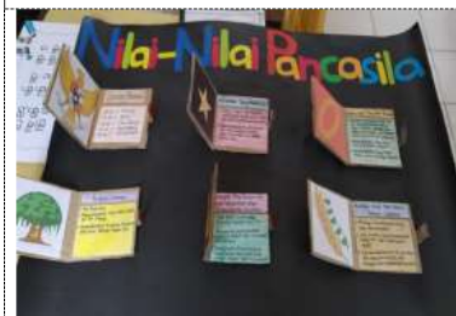
Gambar 4. Hasil Media Pembelajaran Tematik Kurikulum 2013 yang dibuat oleh peserta