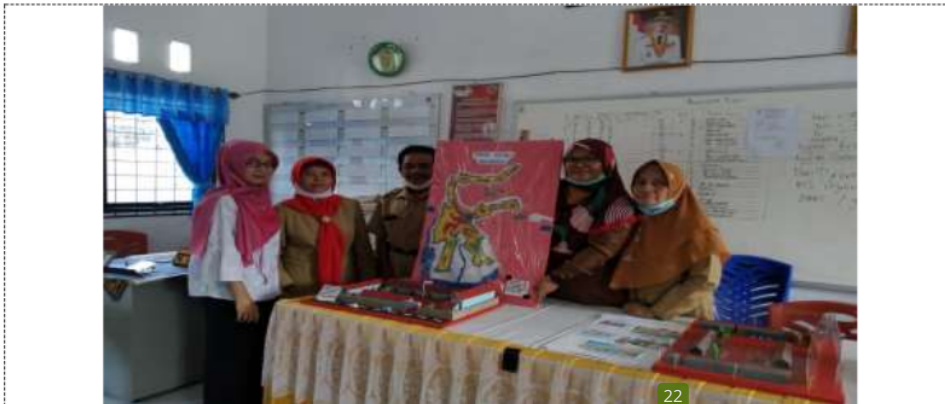
Gambar 3. Hasil Media Pembelajaran Tematik Kurikulum 2013 yang dibuat oleh peserta

Adapun produk media pembelajaran tematik kurikulum 2013 yang dibuat oleh peserta 28 antara lain dapat dilihat pada gambar berikut.