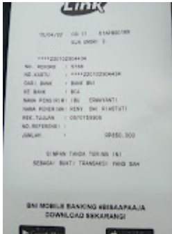
Bukti pembayaran.jpeg 97K