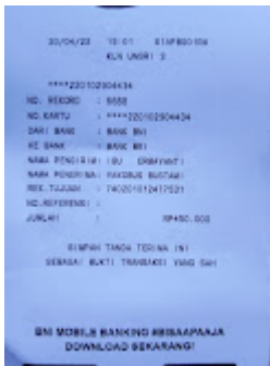
Bukti Pembayaran (2).jpeg 107K