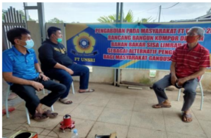
Gambar 3. Team pengabdian sedang bersiap

Kegiatan Pengabdian pada masyarakat dilaksanakan pada hari Minggu tanggal 6 Desember di perumahan Pesona Sriwijaya kecamatan Gandus Palembang yang dihari oleh ibu ibu rumah tangga di tempat tersebut. Seperti yang ditunjukkan pada Gambar-gambar berikut :