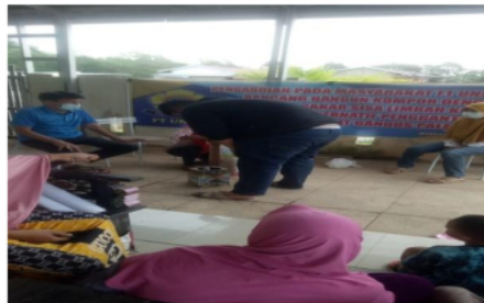
Gambar 6. Ibu-ibu dengan antusias menyaksikan kompor limbah kayu