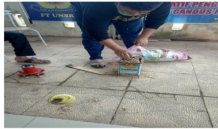
Gambar 4. Peragaan kompor limbah kayu