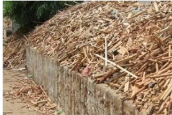
Gambar 4. Bahan baku sekam

Bahan bakar yang digunakan sebagai energi alternatif pengganti LPG atau kerosin yang relatif mahal adalah limbah sisa kayu olah yang tidak berguna lagi.