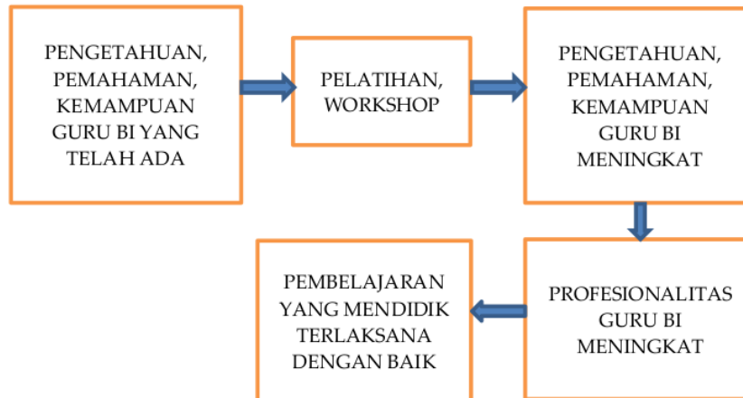
Gambar 1. Alur Metode Pemecahan Masalah

Dalam bentuk bagan terlihat seperti pada Gambar 1.