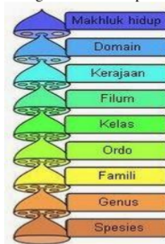
Gambar 1. Tingkatan Taksonomi makhluk hidup

Pada sistem taksonomi, makhluk hidup dibagi dalam tingkatan-tingkatan tertentu mulai dari tingkatan tertinggi yaitu kingdom sampai pada level yang paling detail yaitu spesies. Agar memudahkan dalam pengelompokan Makhluk hidup yang sangat banyak serta beragam, maka dari itu di susunlah suatu aturan pengelompokan. pengelompokan dilakukan pada tingkat tinggi hingga ke tingkat terendah seperti gambar 1.