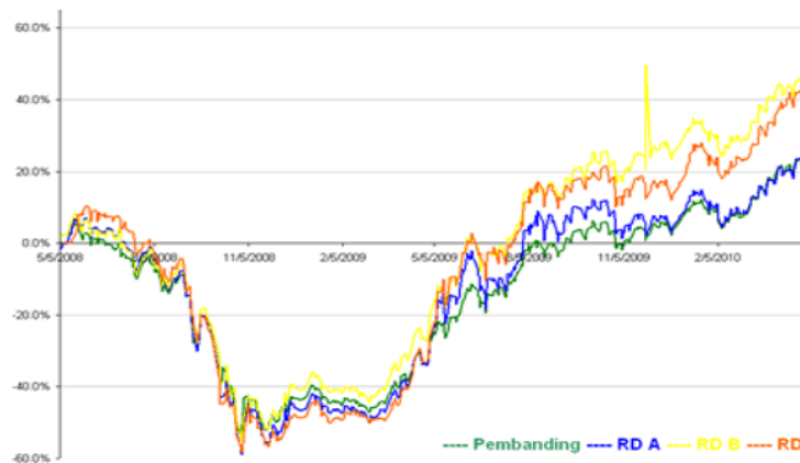
Grafik 1.1 Kinerja Reksa Dana Saham dan IHSIG Sebagai Benchmark

Pada saat terjadinya krisis global yang disebabkan oleh subprime mortgage di Amerika pada tahun 2007 dan masuk ke Indonesia pada tahun 2008 yang kemudian mempengaruhi pasar modal Indonesia. Tidak hanya saham saja yang terkena imbas dari krisis subprime mortgage , namun instrumen-instrumen likuid lainnya seperti reksa dana terutama reksa dana saham pun terkena dampaknya. Dimana return dari reksa dana saham ini menurun sangat tajam, karena pada saat itu IHSIG sebagai benchmark dari reksa dana saham pun berada pada poin terendah pada tanggal 28 Oktober 2008 yaitu menyentuh level 1111.39, merupakan level terendah sejak tahun 2005. Mengalami kerugian yang cukup dalam ketika berinvestasi di instrumen berbasis saham adalah hal yang wajar. Kerugian tajam yang terjadi di tahun 2008 contohnya, ketika itu Indeks Harga Saham Gabungan (IHSIG) Bursa Efek Indonesia yang merupakan barometer investasi di saham mengalami kerugian hingga -50,5%. Sesuai dengan prinsip saham yang akan naik harganya bila perekonomian membaik maka di tahun 2009 ketika perekonomian dunia dan regional membaik IHSIG telah rebound atau naik lagi sebesar 87%. Keadaan reksa dana saham pada saat berlangsungnya krisis global dan pasca krisis digambarkan pada Grafik 1.1. di bawah ini.