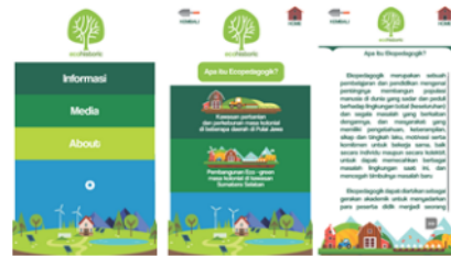
Gambar 5. Tampilan Aplikasi Eco-H

Dalam beberapa tahapan, aplikasi memberikan respon yang lancar. Secara keseluruhan aplikasi dapat digunakan dengan baik serta sesuai dengan rancangan storyboard dan flowchart . Aplikasi Eco-H menggunakan offline System atau tidak menggunakan respon aplikasi secara daring. Seluruh data yang ditampilkan berasal dari internal storage aplikasi atau data yang dibutuhkan sudah ditanamkan di sistem aplikasi.