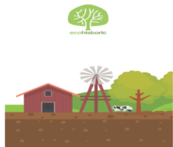
Gambar 4. Menu Home Aplikasi Eco H

Gambar 3 di atas menunjukkan tampilan pembuka ( opening ) aplikasi Eco-H. Gambar peta muncul dengan mode fade in disusul dengan bentuk pohon berwarna hijau dan suara music latar. Kemudian aplikasi akan menampilkan menu home dan tombol home bottom .