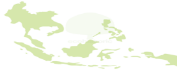
Gambar 3. Tampilan Opening Aplikasi Eco-H

Gambar 3 di atas menunjukkan tampilan pembuka ( opening ) aplikasi Eco-H. Gambar peta muncul dengan mode fade in disusul dengan bentuk pohon berwarna hijau dan suara music latar. Kemudian aplikasi akan menampilkan menu home dan tombol home bottom .