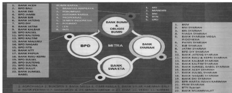
Gambar 4. Mitra Kerja Perum Jamkrindo

Perum Jamkrindo telah berpengalaman di bidang penjaminan kredit selama lebih dua puluh tahun dan bekerjasama dengan lebih tujuh puluh mitra kerja perbankan/nonbank, terdiri dari Bank Pembangunan Daerah (BPD), Bank BUMN, bank swasta nasional baik konvensional maupun syariah serta lembaga keuangan atau instansi penyalur kredit .