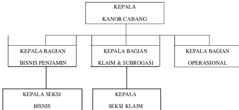
Gambar 2 Struktur Organisasi Perum Jamkrindo Kantor Cabang Palembang