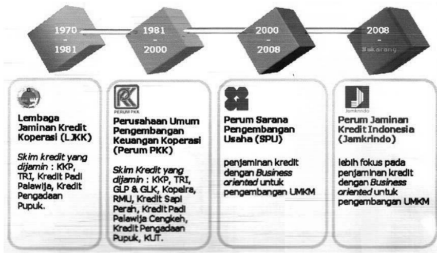
Gambar1. Perubahan bentuk Perusahaan Penjamin

Adapun susunan struktur Organisasi Perum Jamkrindo Kantor Cabang Palembang pada saat ini sebagai berikut: