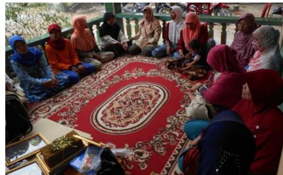
Gambar 3. Penjelasan mengenai tehnik pembuatan kerajinan tangan serta potensinya untuk meningkatkan nilai ekonomi keluarga.

Kegiatan diawali dengan penjelasan kegiatan dengan tujuan untuk memperkenalkan tehnik herbarium untuk mengawetkan bunga dan tanaman sehingga dapat bertahan lama dan tanaman yang telah diawetkan lebih bernilai seni.