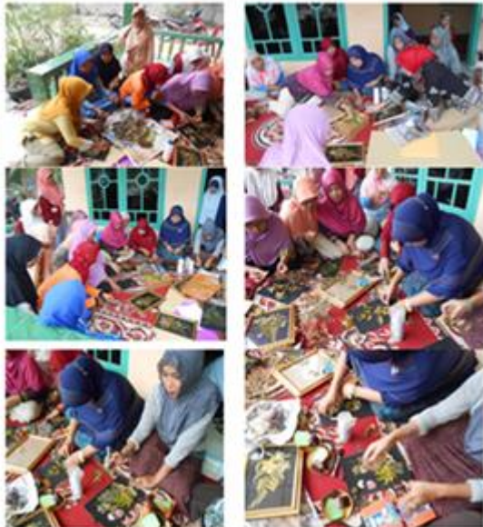
Gambar 5. Ibu-ibu PKK Dusun III, Desa Pulau Semambu mencoba merangkai sendiri kerajinan tangan berbahan dasar bunga kering dengan tehnik herbarium.