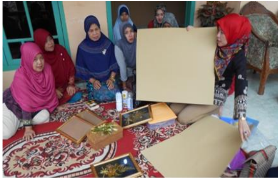
Gambar 4. Peragaan tentang teknik pembuatan kerajinan tangan berbahan dasar bunga kering dengan tehnik herbarium.