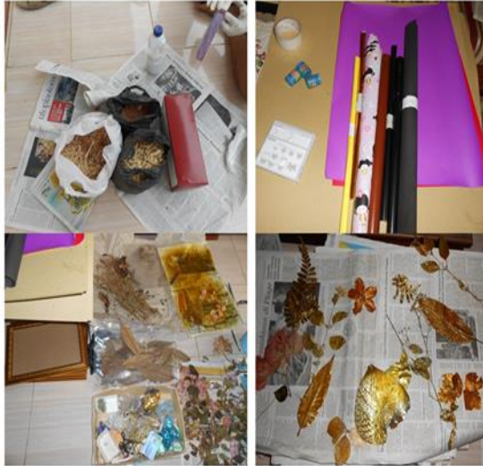
Gambar 2. Alat dan bahan Kegiatan pemanfaatan tanaman berupa bunga dan tanaman untuk bahan pembuatan aneka kerajinan tangan dengan teknik herbarium

Cara pembuatan Bunga dan tanaman dengan teknik herbarium dengan cara mencelupkan pada alkohol 90%, selanjutnya disusun pada lembaran koran sedemikian rupa, selanjutnya dilapisi lagi dengan tumpukan koran dan buku tebal sebagai pemberat dan dibiarkan mengering sempurna selama lebih kurang satu bulan.