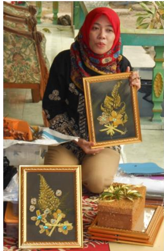
Gambar 6. Hasil akhir kerajinan tangan berbahan dasar bunga dan tanaman dengan tehnik herbarium (hiasan figura dan kotak cinderamata)