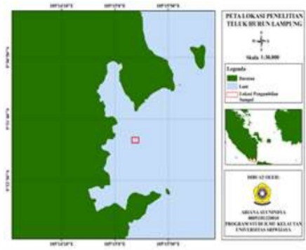
Gambar 1. Lokasi sampling