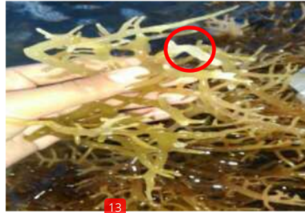
Gambar 3. K. alvarezii yang terkena ice-ice

Gambar 2A merupakan morfologi K. alvarezii hasil penelitian ini, sedangkan 2B merupakan hasil penelitian Parenrengi dan Sulaeman pada Tahun 2007. Rumpun laut K. alvarezii yang ditemukan memiliki ciri-ciri pemutihan pada bagian ujung thallus yang awalnya sedikit dan semakin lama melebar ke bagian percabangan. Warna thallus K. alvarezii terlihat seperti transparan dan struktur yang lebih lunak dan mudah hancur daripada thallus yang tidak mengalami perubahan warna. Ciri-ciri ini menunjukkan rumput laut K. alvarezii yang dibudidayakan di Balai Besar Perikanan Budidaya Laut Lampung ini telah terserang penyakit ice-ice (Gambar 3).