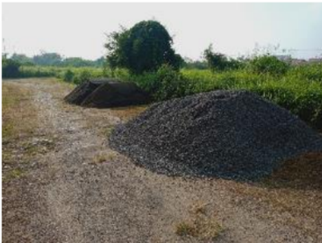
Gambar 7. Material pengecoran jalan