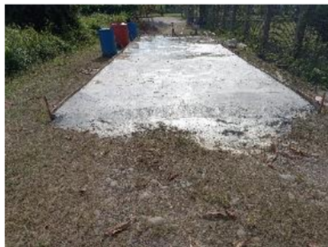
Gambar 11. Hasil sementara perkerasan jalan