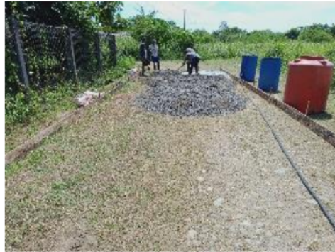
Gambar 9. Proses pencampuran material