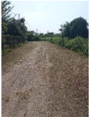
Gambar 6. Kondisi awal lokasi pengabdian

Kegiatan aplikasi aplikasi self-compacting concrete pada pembuatan jalan di Kecamatan Talang Kelapa, Banyuasin ini dilaksanakan pada bulan September hingga Oktober tahun 2022. Kegiatan ini dimulai dengan sosialisasi mengenai pembuatan Self Compacting Concrete kepada warga setempat, kemudian mengaplikasikan ke jalan pada kecamatan Talang Kelapa, Banyuasin, yang pembuatannya dilaksanakan oleh masyarakat setempat.