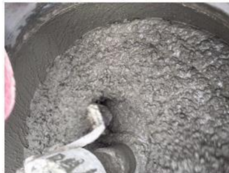
Gambar 5. Adukan beton yang telah flow