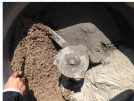
Gambar 4. Proses pencampuran semen