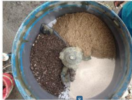
Gambar 3. Proses pencampuran agregat kasar dan agregat halus

5 menit atau material kering sudah tercampur rata. Selanjutnya masukkan material yang bersifat kering yaitu semen kedalam mixer lalu putar hingga 5 menit atau material kering sudah tercampur rata 9 Selanjutnya masukkan 1/3 air sambil 9 xer diputar setelah 1 menit masukkan 1/3 air lagi dan setelah 1 menit masukkan 1/3 air lagi. Selanjutnya superplasticizer perlahan dima 11 kan sambil mixer diputar. Proses pengecoran SCC dapat dilihat pada Gambar 3, 4 dan 5.