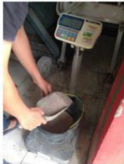
Gambar 2. Penimbangan material agregat halus

Proses persiapan material penyusun SCC diawali dengan menimbang material ber- 15 kering dan basah. Material bersifat kering adalah semen, agregat kasar, agregat halus, dan abu ampas tebu, sedangkan material bersifat basah adalah air dan superplasticizer . Proses penimbangan material terdapat pada Gambar 2.