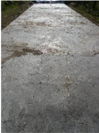
Gambar 12. Hasil akhir perkerasan jalan.