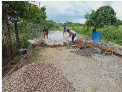
Gambar 10. Proses pencampuran material SCC