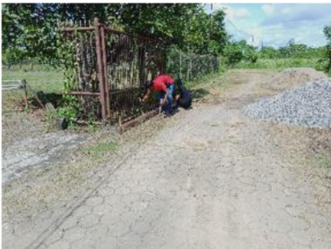
Gambar 8. Proses pemasangan bekisting jalan