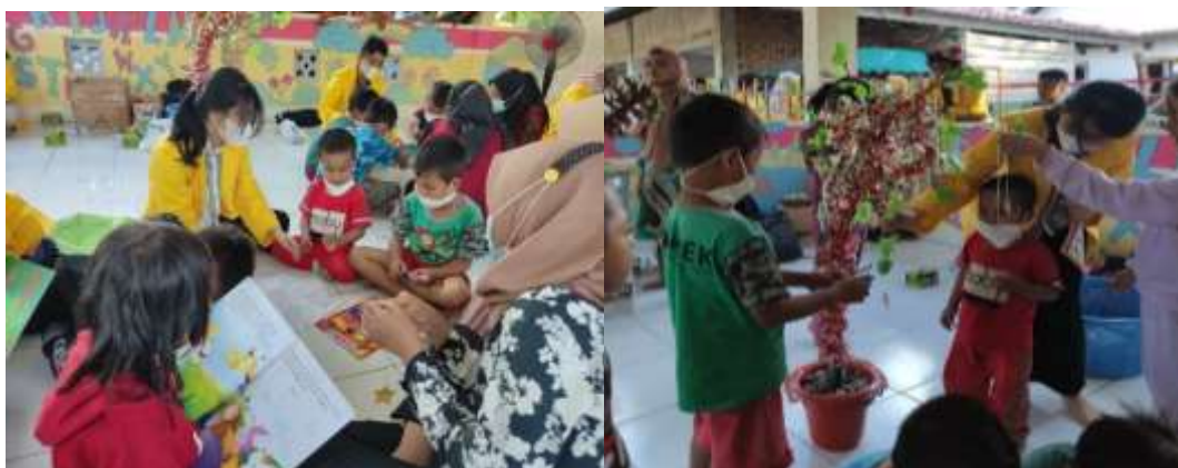
Gambar 3. Pelaksanaan Lapak Baca dan Pengantungan Cita-Cita Anak-anak di Pohon Harapan

Kegiatan ini diharapkan menumbuhkan semangat anak-anak di desa dalam membaca dan menulis sehingga keinginan atau cita-cita yang mereka impikan akan di simpan di pohon harapan. Pohon harapan ini akan menjadi gambaran kegiatan keberlanjutan pada kegiatan selanjutnya.