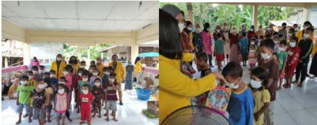
Gambar 4. Pembagian Hadiah kepada Anak-anak

menerapkan protokol kesehatan dengan pembagian masker dan penyediaan tempat cuci tangan sebelum masuk ke lokasi kegiatan. Hadiah yang diberikan berupa buku bacaan, buku tulis, poster dan bingkisan yang berisikan snack anak-anak. Pembagian hadiah bertujuan untuk memberikan apresiasi terhadap kegiatan yang telah dilakukan sehingga mereka bersemangat untuk membaca buku, dan bermain bersama. Nurhuda & Setyaningtyas (2022) mengatakan mengenai pengalaman yang didapatkan dari sebuah kegiatan merupakan suatu hal yang berharga dan dapat menjadi pelajaran untuk masa mendatang.