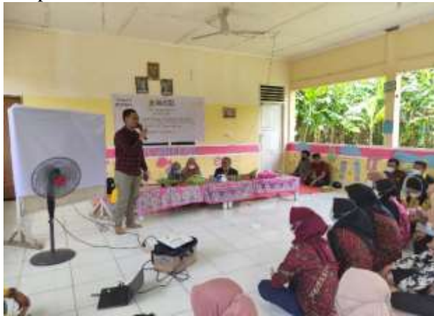
Gambar 2. Kegiatan Penyampaian Materi oleh Founder Sobat Literasi Jalanan Kota Palembang dan Diskusi Bersama Putera Puteri Karang Taruna.

menonjol, hal tersebut terlihat dari semangat mereka kelakukan kegiatan tersebut. Sehingga penyampaian materi literasi ini sangat diharapkan dapat ditularkan dan di praktekan ke anak-anak di desa setempat. Banyak harapan kami kepada putera puteri karang taruna untuk menjembatani kegiatan ini kepada anak-anak di desa setempat.