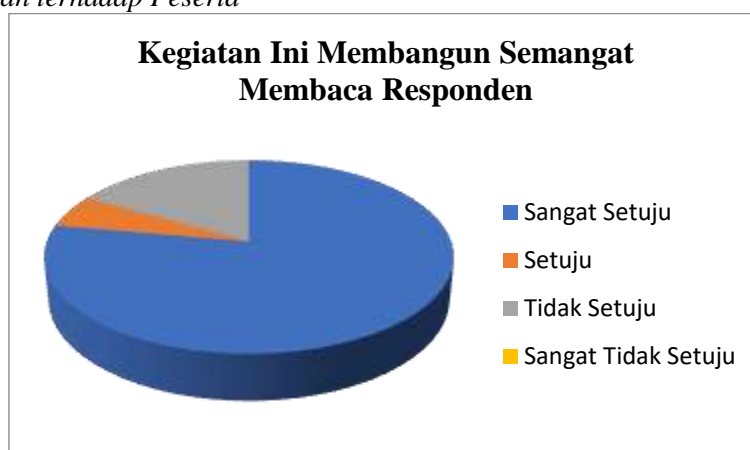
Gambar 6. Dampak Setelah Kegiatan Terhadap Semangat Membaca Responden