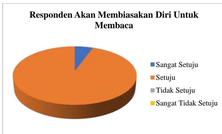
Gambar 7. Dampak Setelah Kegiatan Terhadap Kebiasaan Membaca Responden

Dari gambar 6 terlihat bahwa sebanyak 77,7 persen responden sangat setuju dan 16,6 persen responden setuju bahwa kegiatan dapat membangun semangat membaca responden. Artinya secara keseluruhan kegiatan ini telah berdampak dalam meningkatkan semangat membaca bagi responden. Sementara pada 7 dapat diketahui bahwa sekitar 94 persen responden setuju dan 6 persen responden sangat setuju untuk membiasakan diri untuk membaca setelah pelaksanaan kegiatan ini. Dengan kata lain bahwa kegiatan ini telah memberikan dampak positif kepada sebagian besar peserta pengabdian atau responden untuk membiasakan diri dalam membaca.