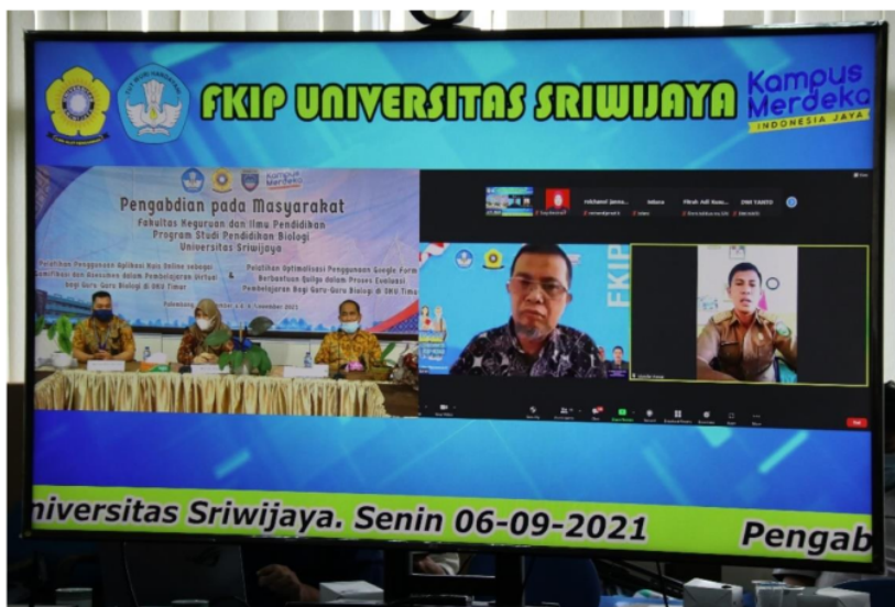
Gambar 1. Pembukaan dan pengarahan dari Ketua MGMP Biologi OKU Timur

Kegiatan ini dibuka oleh Wakil Dekan Bidang Akademik Fakultas Keguruan dan Ilmu Pendidikan Universitas Sriwijaya dan dilanjutkan dengan pengarahan dari Ketua MGMP Biologi pada jenjang SMA di Kabupaten OKU Timur. Setelah kegiatan pembuka dilaksanakan, selanjutnya peserta diberikan pre-test untuk mengetahui pemahaman awal peserta terhadap penggunaan Google Form . Dokumentasi Kegiatan Pengabdian Kepada Masyarakat disajikan pada Gambar berikut.