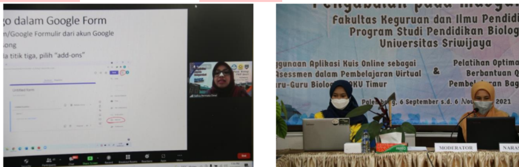
Gambar 2. Pemberian Materi Pelatihan

Sebelum pemberian materi, dilakukan pre-test yang bertujuan untuk menggali pengetahuan peserta tentang penggunaan Google Form didukung dengan aplikasi Quilgo dalam proses pembelajaran. Pelaksanaan pre-test dilakukan dengan memberikan soal pilihan ganda dengan menggunakan Google Form yang berjumlah 10 soal dalam waktu 10 menit. Penyebaran soal pre-test dilakukan dengan memberikan tautan Google Form kepada peserta melalui fitur chat pada Zoom Meetings. Saat peserta mengerjakan soal pre-test , narasumber mulai melakukan persiapan untuk sesi pemberian materi pelatihan. Setelah pre-test dilaksanakan, kemudian dilanjutkan dengan pemberian materi tentang pemanfaatan Quilgo dalam Google Form .