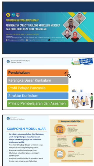
Gambar 2 Materi Pelatihan

Kegiatan kedua, Pelaksanaan. Pelaksanaan kegiatan berlangsung secara tatap muka. Setelah pelaksanaan kegiatan, proses pembimbingan selanjutnya dilaksanakan secara online dimulai pada bulan September-Oktober 2022. Pada kegiatan ini diikuti sebanyak 40 peserta guru yang tergabung dalam MGMP IPA Kota Pagaralam baik guru yang berada di bawah Kementerian Pendidikan dan Kebudayaan maupun di bawah Kementerian Agama. Panitia dosen, narasumber, mahasiswa yang terlibat dan peserta guru yang melaksanakan kegiatan tetap menjalankan protokol kesehatan.