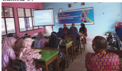
Gambar 3 Penyampaian Materi oleh Narasumber

kegiatan pendampingan dilaksanakan secara online melalui WhatsApp Group , Learning Management System Canvas , dan pertemuan online melalui Zoom Meeting . Dokumentasi kegiatan pada Gambar 3.