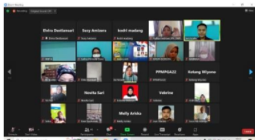
Gambar 1 Kegiatan Pra-Service (Pertemuan awal dengan guru MGMP IPA Se-Kota Pagaralam)

Pelaksanaan Kegiatan Pengabdian pada Masyarakat skema Perkuliahan Desa yang diselenggarakan oleh Program Studi Pendidikan Biologi Jurusan Pendidikan IPA FKIP UNSRI dilakukan secara luring dan daring. Analisis situasi, persiapan pengabdian, persiapan materi dan administrasi dilaksanakan dari bulan Juli. Pada dasarnya, kegiatan terdiri dari kegiatan Pra-service (pendahuluan), In-service (pelaksanaan) dan on service (pendampingan). Pada kegiatan Pra-service dilakukan sebagai bentuk pertemuan awal dengan guru-guru IPA SMP Se-Kota Pagaralam yang dilaksanakan secara daring. Pada tahap ini juga dijelaskan persiapan kelas online melalui learning management system . Dokumentasi kegiatan disajikan pada Gambar 1.