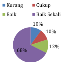
Gambar 5 Hasil Post-test

kegiatan. Pemahaman guru terkait materi kegiatan berada pada kategori kurang dan cukup yaitu masing-masing sebanyak 4 peserta dengan persentase 10%. Peserta yang dikategorikan baik sebanyak 5 peserta dengan persentase 12.5% dan yang terkategori baik sekali sebanyak 27 peserta dengan persentase 67.5%. Pada tahap ini, diketahui bahwa pada tahap evaluasi akhir jumlah peserta yang menempati kategori kurang dan cukup mengalami penurunan dan terdapat kategori baru yaitu baik sekali. Hasil ini peningkatan setelah peserta telah mendapatkan pengetahuan terkait materi kegiatan. Pemahaman peserta pelatihan setelah pelatihan terhadap materi kegiatan disajikan Gambar 5.