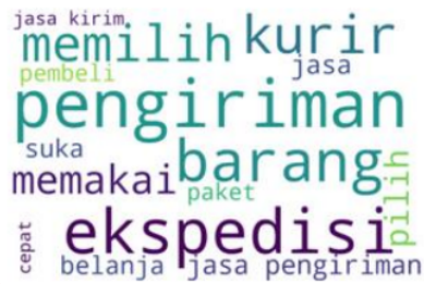
Gambar 5 Wordcloud Review Aspek Distribution

Dari Gambar 5 terdapat Kata-kata “ekspedisi”, “jasa”, “pengiriman”, “pilih”, dan “memilih” memberikan informasi bahwa customer tidak suka dengan adanya pemilihan ekspedisi berdasarkan pilihan pihak Shopee dan menginginkan adanya pemilihan jasa ekspedisi sesuai keinginan customer .