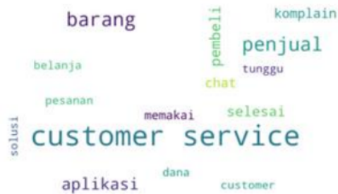
Gambar 2 Wordcloud Review Aspek People

Dari Gambar 2 terdapat Kata-kata “customer”, “service”, “selesai”, “chat”, “komplain”, dan “solusi” memberikan informasi bahwa solusi yang diberikan dari pelayanan chat customer service dari Shopee tidak menyelesaikan masalah komplain dari customer dan terkadang customer service bahkan mematikan chat sebelum masalah yang dimiliki oleh pelanggan terselesaikan.