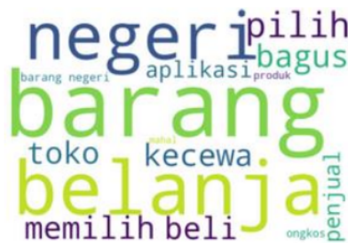
Gambar 6 Wordcloud Review Aspek Product

Dari Gambar 6 terdapat Kata-kata “negeri”, “barang”, “belanja”, “pilih”, dan “produk” memberikan informasi bahwa customer di Shopee tidak menginginkan kebijakan penghapusan berbelanja produk/barang dari luar negeri.