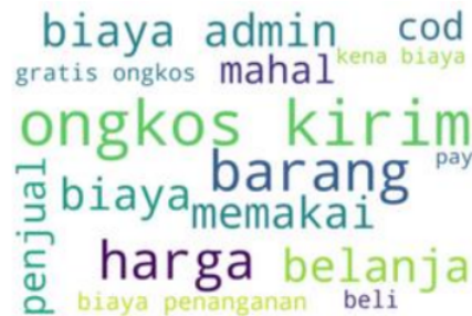
Gambar 3 Wordcloud Review Aspek Price

Dari Gambar 3 terdapat Kata-kata “biaya”, “admin”, “penanganan”, “harga”, “ongkos”, “kirim”, dan “mahal” memberikan informasi bahwa customer Shopee protes dengan adanya biaya admin dan penanganan serta mahal nya harga ongkos kirim yang lumayan membebani customer .