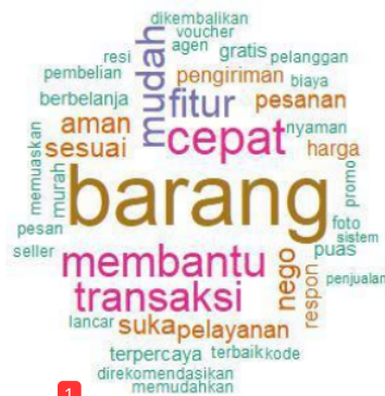
Gambar 1: Contoh Wordcloud