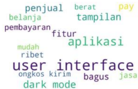
Gambar 9 Wordcloud Review Aspek Physical Evidence

Dari Gambar 9 terdapat Kata-kata “user”, “interface”, “dark”, “mode”, “aplikasi”, dan “fitur” memberikan informasi bahwa user interface aplikasi Shopee perlu di tambah fitur dark mode serta ditingkatkan lagi kemudahannya bagi customer untuk menggunakannya.