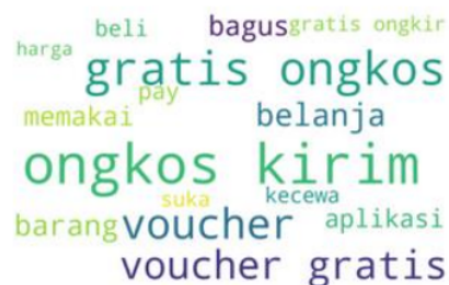
Gambar 4 Wordcloud Review Aspek Promotion

Dari Gambar 4 terdapat Kata-kata “voucher”, “gratis”, “memakai”, “belanja”, “ongkos”, dan “kirim” memberikan informasi bahwa banyak customer yang berbelanja di Shopee tidak bisa menggunakan dan memintanya ditambahkannya voucher promo terutama voucher untuk gratis ongkos kirim.