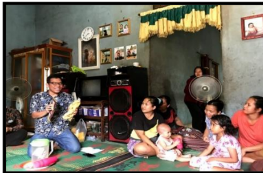
Gambar 6. Diskusi peserta dan tim pengabdian

Berdasarkan hasil umpan balik dari kuesioner yang telah diberikan kepada peserta ada beberapa pendapat dan saran peserta terhadap kegiatan yang telah dilaksanakan di Desa Tanjung Pering pada tanggal 13 Agustus 2022. Secara keseluruhan pendapat dari para peserta kegiatan ini adalah positif, Mereka beranggapan bahwa dengan adanya kegiatan ini dapat menambah wawasan yang bermanfaat bagi peserta. Peserta merasa memiliki pengetahuan dan dapat menginspirasi dari kegiatan pengabdian ini. Saran mereka untuk kegiatan selanjutnya yakni mereka menghendaki agar kegiatan seperti ini rutin dilaksanakan.