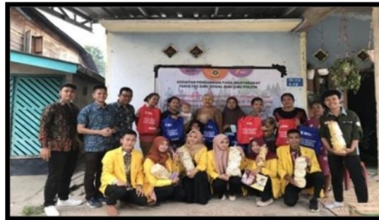
Gambar 7. Foto Bersama Peserta dan Tim Pengabdian

Tidak hanya berhenti pada kunjungan dan pelatihan, kegiatan pengabdian masyarakat ini juga turut melakukan tindak lanjut untuk memantau pelaku UMKM yang telah mengikuti pelatihan ini. Tindak lanjut ini dilakukan dengan cara melakukan wawancara mendalam di tanggal 15 Agustus 2022 dengan mendatangi para pelaku usaha Desa Tanjung Pering, Kecamatan Indralaya Utara Kabupaten Ogan Ilir, Sumatera Selatan, Tabel 1. Merupakan hasil wawancara mendalam yang dilakukan terhadap pelaku usaha.