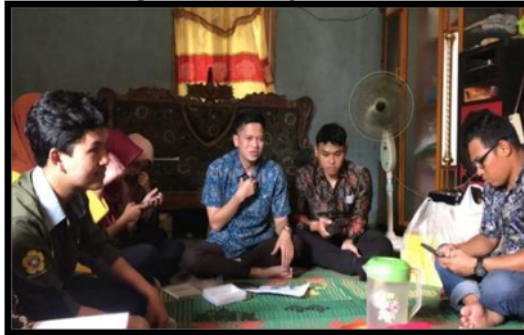
Gambar 2. Materi Kedua : strategi pengemasan dan promosi produk UMKM

promosi produk bagaimana kemasan yang baik dan menarik dan awet tidak mudah lempam. dan di akhir materi kedua ini, dijelaskan bahwa pada saat ini pengaruh kemasan sangat mempengaruhi minat konsumen karena mampu menambah nilai dan fungsi kemasan itu sendiri dan menjadi pembeda dari produk lainnya.