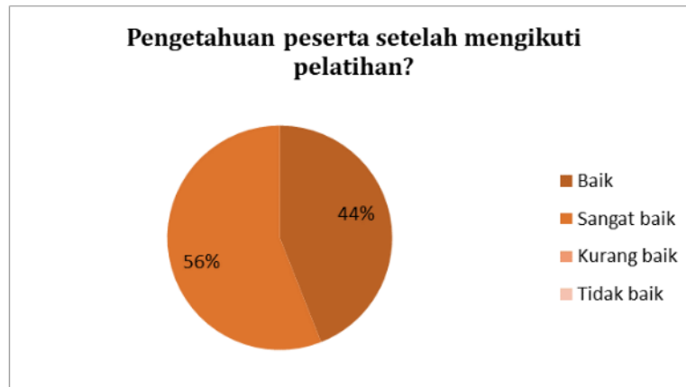
Gambar 5. Hasil kuesioner pertanyaan ketiga

Secara lebih lanjut dapat melihat seberapa jauh pengetahuan dan pemahaman yang didapatkan oleh peserta dengan adanya kegiatan pengabdian di Desa Tanjung Pering ini membuat mereka semakin termotivasi untuk mengenal dan memperoleh ilmu mengenai inovasi dan kreativitas pada packaging produk dan merk. Keterbatasan para pelaku UMKM membuat kembali bersemangat untuk memperoleh ilmu dari kegiatan ini. Hal ini tercermin dari hasil kuesioner yang diperoleh dan semangat mereka mengikuti pengabdian ini, Diharapkan ilmu yang diberikan pada kegiatan ini dapat diterapkan dan menjadi bekal mereka menjadi lebih baik dari sebelumnya.