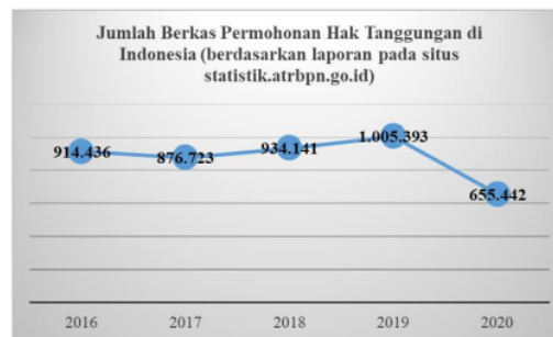
Grafik 1. Jumlah Berkas Permohonan Hak Tanggungan di Indonesia (2016-2020)

Pada tahun 2020 diterbitkanlah Peraturan Menteri Negara Agraria Nomor 5 Tahun 2020 tentang Pelayanan Hak Tanggungan Terintegrasi Secara Elektronik. Adanya layanan elektronik ini, diharapkan dapat meningkatkan kualitas dan kuantitas pelayanan pertanahan di Kementerian ATR/BPN. Namun sayangnya pada tahun 2020, justru jumlah permohonan hak tanggungan di Indonesia mengalami penurunan dari 5 tahun terakhir, menjadi 655.442 berkas, seperti yang tergambar dalam Grafik 1.1.