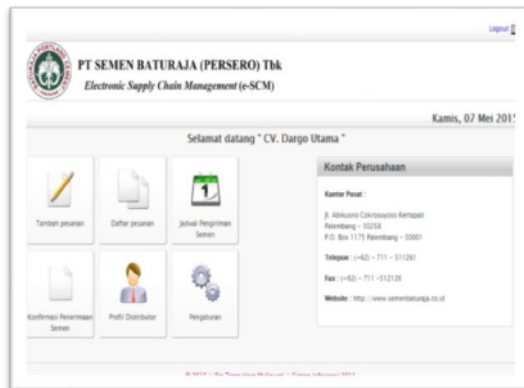
Gambar 1. Halaman utama distributor

Electronic Supply Chain Management distribusi semen pada PT. XYZ merupakan aplikasi berbasis website yang dibangun untuk mendukung proses pendistribusian semen. Sistem ini akan dibagi berdasarkan level pengguna yaitu Distributor, Bagian Penjualan, Bagian Produksi, dan Bagian Distribusi.