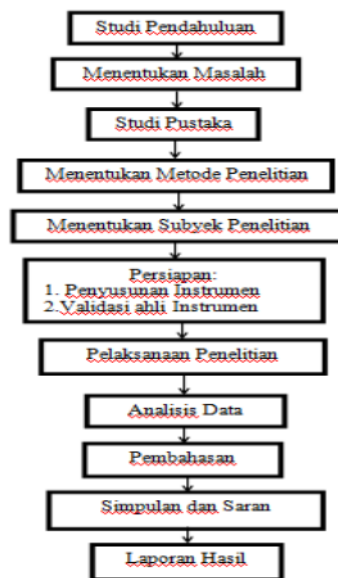
Gambar 1. Alur Penelitian

Metode penelitian yang digunakan dalam penelitian ini adalah metode deskriptif yang bertujuan untuk mengetahui kemampuan berpikir secara eksperimen yang dirancang oleh mahasiswa dalam memecahkan masalah fisika.