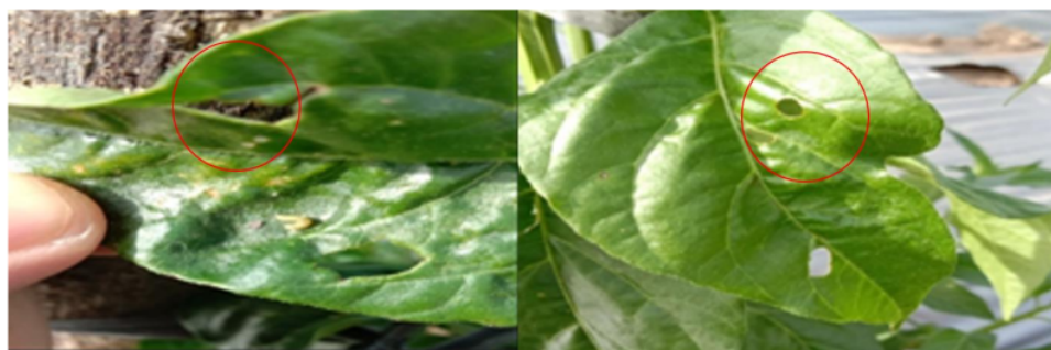
Gambar 1. Gejala serangan hama Mandibulata pada tanaman cabai desa Kerinjing

Hama mandibulata pada tanaman cabai adalah hama yang menyerang tanaman dengan cara menggigit mengunyah. Hama biasanya menyerang daun tanaman, gejala yang sering dijumpai ketika hama ini sudah menyerang yaitu adanya bekas gigitan yang terdapat pada bagian pinggir daun cabai. Hama mandibulata pada tanaman cabai biasanya Spodoptera litura . Dimana hama ini menyerang bagian daun tanaman dengan menggigit bagian daun sehingga tanaman mengalami kerusakan. Berdasarkan hasil praktek lapangan serangan hama tidak terdapat perbedaan yang signifikan antara lahan cabai monokultur dengan lahan cabai tumpangsari kubis (Gambar 1).