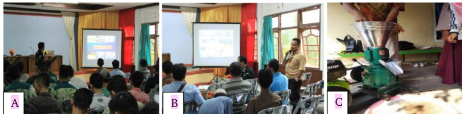
Gambar 1. Kegiatan penyuluhan: A) Penyampaian materi, B) Diskusi, C) Praktik pembuatan pakan ikan.

Kegiatan penyuluhan dilakukan dengan melibatkan seluruh tim, pembudidaya ikan dan mahasiswa yang terlibat dalam praktik lapang di lokasi pengabdian. Dokumentasi kegiatan penyuluhan disajikan pada Gambar 1.