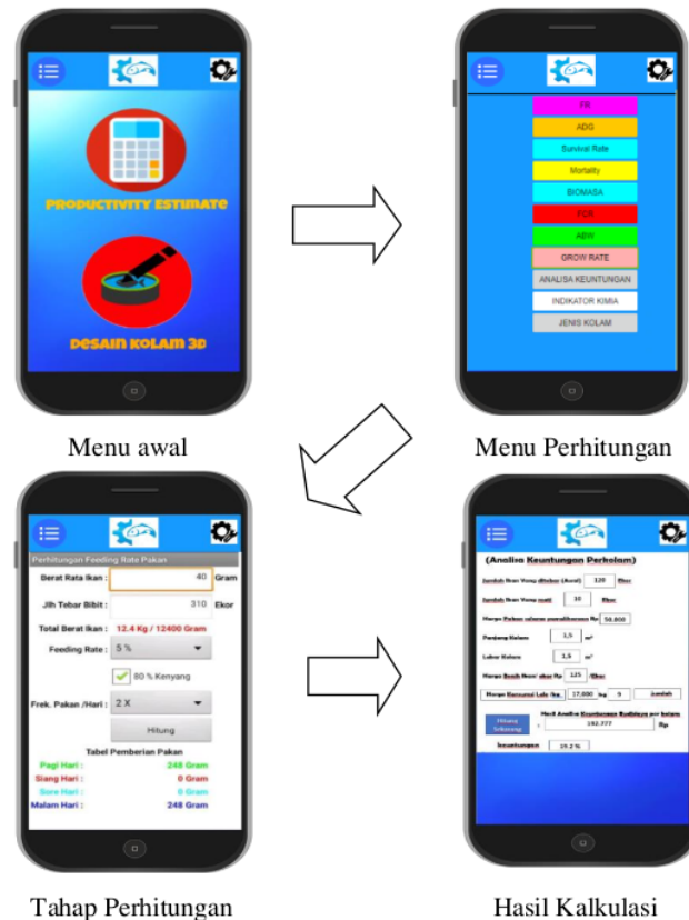
Gambar 3. Alur pengujian cara kerja aplikasi AQDENPRO pada smartphone untuk menu perhitungan dan hasil

adalah apabila biomassa pada periode pemeliharaan tertentu mempunyai nilai bobot signifikan. Hal ini juga berlaku apabila nilai bobotnya sama dengan total pakan yang diberikan. Sehingga, hal ini menunjukkan bahwa pakan yang diberikan selama pemeliharaan ikan dalam paruh waktu tertentu adalah cukup dan efisien (Harris, 2010).