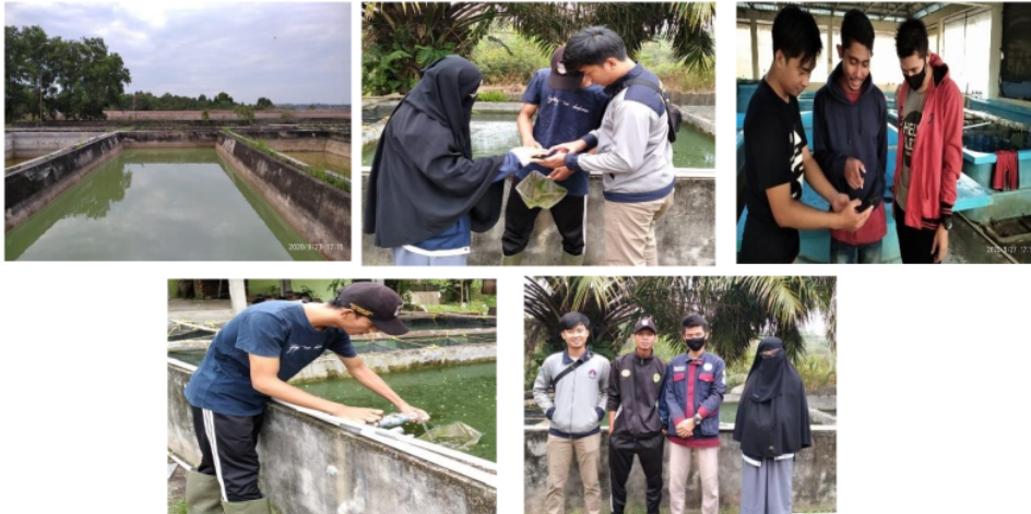
Gambar 2. Kegiatan observasi dan wawancara pembudidaya di Desa Tanjung Pering Kabupaten Ogan Ilir Sumatera Selatan

merupakan alternatif solusi aplikasi android hasil pengembangan yang bekerja dengan teknik penginputan dan pengolahan data. Aplikasi ini juga berbasis desain 3D yang mempunyai 2 output yaitu hasil data dan juga gambar 3D.