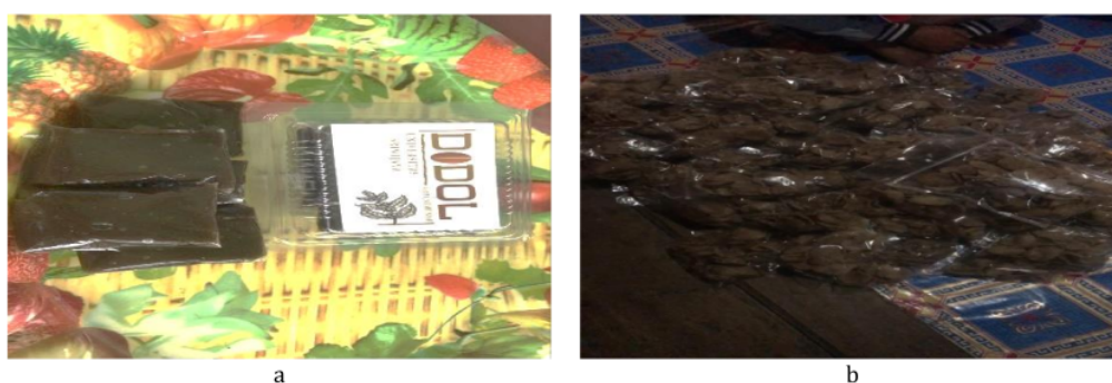
Gambar 4 a) Produk dodol kopi dan b) Produk kemplang (kerupuk) kopi.

mempunyai beberapa kendala di lokasi. Tabel 1 menjelaskan hambatan yang terjadi dalam pemberdayaan.