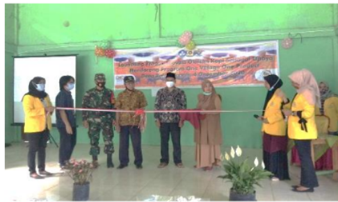
Gambar 5 Launching dan peresmian produk olahan kopi.

Kegiatan launching produk dodol kopi dan kerupuk kopi dilaksanakan pada 4 Desember 2020, di balai Desa Palak Tanah Semenda. Kegiatan dimulai pada pukul 14.00 WIB—selesai, dengan kapasitas peserta yang hadir berjumlah 100 orang. Launching produk dihadiri oleh para perangkat desa, di antaranya kepala desa dan Camat Semende Darat Tengah (Gambar 5). Acara berlangsung dengan peresmian produk oleh camat, kemudian pemutaran video dokumenter pengolahan kerupuk kopi dan dodol kopi dan diakhiri dengan mencicipi produk oleh peserta. Kegiatan ini juga dimuat dalam publikasi media online lokal di Sumatera Selatan, yaitu Times Indonesia (Gambar 6) dengan link akses https://www.timesindonesia.co.id/read/news/313971/keren-mahasiswa-kkn-sosiologi-unsri-launching-dodol-kopi-dan-kerupuk-kopi .