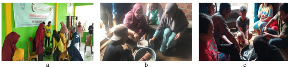
Gambar 2 a) Praktik pembuatan dodol kopi tahap pertama (inisiasi); b) Praktik Pembuatan dodol kopi tahap kedua (pengembangan); dan c) Praktik pembuatan dodol kopi tahap ketiga (finalisasi).

Tahap pertama (ujicoba) dilakukan pada tanggal 8 November 2020 di Posko KKN (Gambar 3 a). Dalam pelaksanaannya dilakukan secara mandiri oleh mahasiswa KKN itu sendiri. Pada tahap uji coba ini, teknik yang digunakan sama halnya seperti membuat adonan pempek lenjer pada umumnya di Palembang. Hasilnya cukup berhasil hal ini dilihat dari segi rasa kopi cocok dijadikan bahan tambahan dalam pembuatan kerupuk, ketika digoreng sudah mengembang. Adapun evaluasi untuk percobaan ini yaitu bentuk kerupuknya masih belum konsisten, dan dalam segi rasa masih kurang asin dan gurih. biaya yang di keluarkan dalam praktek pembuatan tahap satu berkisar Rp 22.000 untuk \frac{1}{4} kg sagu.