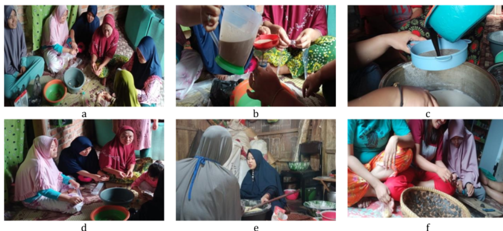
Gambar 3 a) Praktik pembuatan kerupuk kopi tahap pertama (ujicoba); b) Praktik pembuatan kerupuk kopi tahap kedua (inisiasi); c) Praktik pembuatan kerupuk kopi tahap ketiga (pengembangan awal); d) Praktik pembuatan kerupuk kopi tahap keempat (pengembangan akhir ); e) Praktik pembuatan kerupuk kopi tahap kelima (pematapan); dan f) Praktik pembuatan kerupuk kopi tahap keenam (finalisasi).