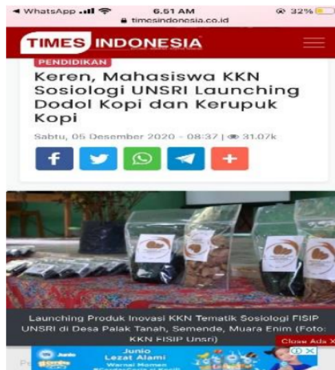
Gambar 6 Publikasi kegiatan di media massa.