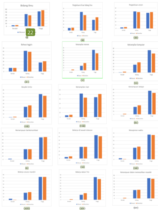
Gambar 4. Histogram frekuensi jawaban responden pada setiap item kompetensi

Berdasarkan Gambar 4, rata-rata jawaban responden pada setiap item kompetensi untuk persepsi kompetensi yang dikuasai dengan kompetensi yang dibutuhkan, dapat dibagi 3 kelompok, yaitu: rata-rata persepsi alumni pada tingkat kompetensi yang dikuasai lebih besar, lebih kecil, dan sama dengan tingkat kompetensi yang dibutuhkan pada bidang pekerjaan.