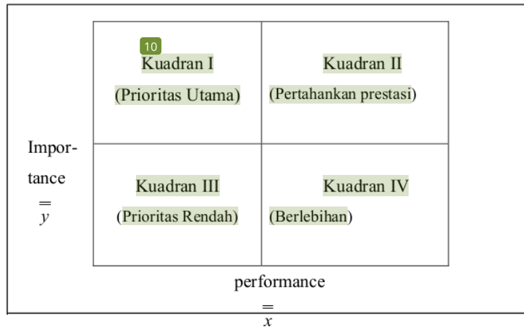
Gambar 2.1. Pembagian Kuadran Importance-Performance Analysis

Diagram Importance-Performance Analysis (IPA) ini (Gambar 2.1) terdiri dari empat kuadran, yaitu: