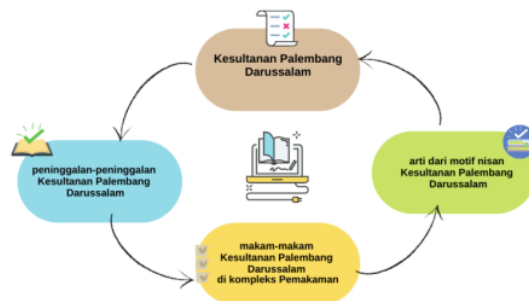
Gambar 2. Peta Materi Bahan Ajar

Pada langkah perencanaan peneliti menentukan topik atau ide (Rinaldi, 2018) dalam bahan ajar berbasis media autoplay studio 8 dan desain peta materi yang terdiri dari peninggalan-peninggalan Kesultanan Palembang Darussalam, makam-makam Kesultanan Palembang Darussalam di kompleks Pemakaman dan arti dari motif nisan Kesultanan Palembang Darussalam. Selanjutnya peneliti juga mendesain flowchart dan storyboard berikut ini gambar pada tahap perencanaan.