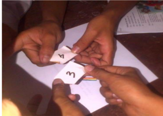
Gambar 1. Pengambilan Kupon Undian

Dari dialog diatas dan gambar 1 terlihat siswa bingung dalam menjawab soal nomor 3, setelah diberikan bimbingan dari guru, siswa mulai bisa menjawab soal nomor 3.