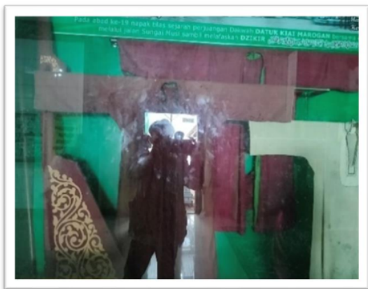
Gambar 10 Baju Gamis Ki Marogan

Dua lembar baju rompi atau baju luar pakaian Ki Marogan. Satu berwarna Hitam dengan motif sulaman “Muhammad bertangkup” seperti pada gambar 11 .