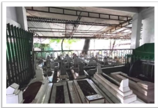
Gambar 8 Makam Keturunan Ki Marogan

Di Komplek Pemakaman Ki Marogan terdapat juga makam zuriat atau keluarga yang masih termasuk dari keturunan Ki Marogan seperti pada gambar 8 berikut.