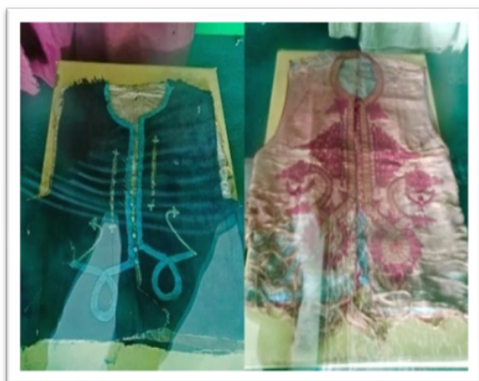
Gambar 11 Baju Rompi Ki Marogan

Dua lembar baju rompi atau baju luar pakaian Ki Marogan. Satu berwarna Hitam dengan motif sulaman “Muhammad bertangkup” seperti pada gambar 11 .