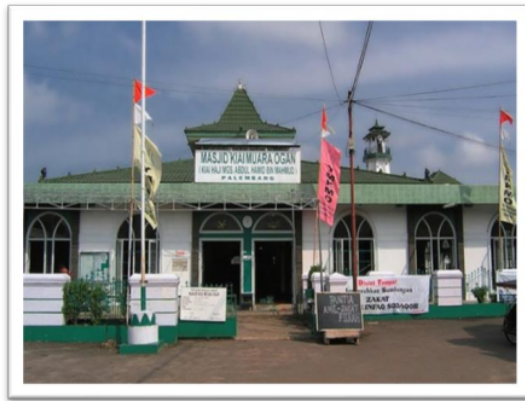
Gambar 9 Masjid Ki Marogan

Masjid Ki Marogan ini didirikan pada tahun 1310 H (1889 M). Pembangunan masjid ini mulai dilakukan setelah Ki Marogan pulang dari tanah suci Mekkah yang terdapat pada pernyataan tertulis dengan nashan Najar Mujai Lillahi Ta'ala , 6 Syawal 1310 H. Masjid ini menjadi situs peninggalan proses penyebaran agama Islam di Palembang (Syukri, 2016).