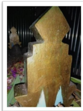
Gambar 5 Makam Kiai Muda

Pada gambar 5 merupakan batu nisan dari makam Kiai Muda. Batu nisan pada makam Kiai Muda terbuat dari batu andesit, akan tetapi batu nisan tersebut dilakukan pemugaran menjadi bentuk kubah masjid dengan ukiran segitiga dibagian bawahnya. Pada batu nisan tidak ditemukan ragam hias atau ukiran.