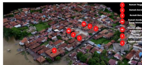
Gambar 3. Kondisi Kampung Al Munawar

Kampung Al Munawar diduga telah ada dan dihuni di akhir abad 18 dengan dibangunnya rumah Tinggi. Kampung ini didirikan oleh Habib Hasan Abdurachman bin Achmad Al-Munawar. Rumah-rumah yang ada di kampung ini merupakan rumah bagi anak-anak Habib Hasan Abdurachman (Purwanti, 2017). Tipologi fungsi bangunan pada