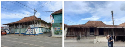
Gambar 4. Rumah Tinggi (kiri) dan Rumah Darat (kanan)

Langgam yang pertama adalah langgam arsitektur vernakular Palembang, yaitu bentuk rumah yang menggunakan pendekatan dari rumah-rumah vernacular yang ada di Palembang terutama rumah limas. Terdapat dua rumah dengan pendekatan ini yaitu Rumah Tinggi dan Rumah Darat. Rumah Tinggi menggunakan langgam Rumah Limas Gudang sedangkan Rumah Darat menggunakan langgam Rumah Limas.