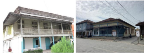
Gambar 6. Rumah Kembar Laut (kiri), Rumah Batu (kanan)

disebut dengan arsitektur indis (Prastiwi et al., 2019).