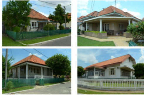
Gambar 10. Empat Rumah Amatan di Kampung Assegaf Sumber: Tim Peneliti, 2022

Sedangkan untuk fungsi hunian di Kampung Assegaf hanya terdapat 1 langgam yaitu arsitektur Indis.