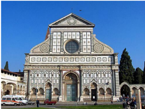
Gambar 9. Santa Maria Novella, Florence oleh Alberti

Jika diperhatikan sekilas, tampak depan dari pabrik es ini mempunyai siluet seperti arsitektur yang dikembangkan oleh Leon Battista Alberti – tokoh arsitek masa Renaissance. Langgam yang dilakukan oleh Alberti mengutamakan tampilan yang harmonis seimbang antara fungsi dan dekorasi (Cartwright, 2020).