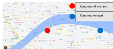
Gambar 2. Posisi Kampung Pengamatan Sumber: Tim Penulis (diolah dari Googlemaps ), 2022