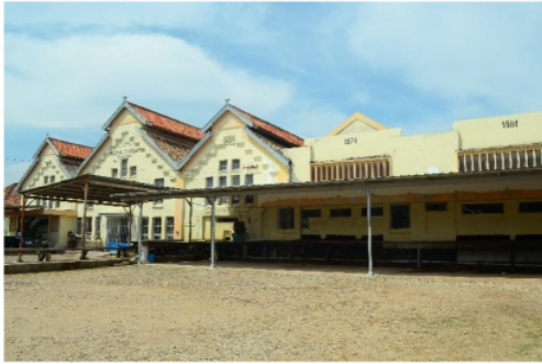
Gambar 8. Tampak Depan Pabrik Es Assegaf

Jika diperhatikan sekilas, tampak depan dari pabrik es ini mempunyai siluet seperti arsitektur yang dikembangkan oleh Leon Battista Alberti – tokoh arsitek masa Renaissance. Langgam yang dilakukan oleh Alberti mengutamakan tampilan yang harmonis seimbang antara fungsi dan dekorasi (Cartwright, 2020).