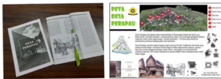
Gambar 6. Buku, pamflet, dan papan iklan sebagai sarana memperkenalkan potensi wisata Desa pada masyarakatnya

kemampuan menyediakan kuliner tradisional yang terkenal lezat. Untuk pengembangan Desa Wisata, toko kuliner dan kerajinan juga perlu ditingkatkan. Desa menyimpan beberapa potensi untuk kuliner seperti kopi semendo dan kerajinan anyaman rotan. Walaupun kedua produk tersebut telah dikenal luas, sampai saat ini masyarakat masih belum mengoptimalkan pemasaran dan penjualannya. Pengunjung yang datang juga sulit mendapatkan kopi asli daerah ini.