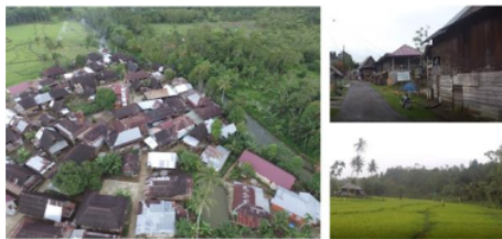
Gambar 4. Lanskap alam Desa Perapau

menghargai warisan leluhur, nilai-nilai simbolik, atau berkaitan dengan spiritual (Oliver, 2006). Rumah Baghi pada desa Perapau terkonservasi karena rumah baghi karena penduduk menjalankan adat rumah tunggu. Rumah tunggu adalah istilah yang digunakan masyarakat setempat untuk rumah keluar 7 . Rumah yang dimiliki oleh keluarga besar dan diwariskan secara turun temurun kepada ahli waris yang disepakati bersama-sama menurut adat. Ahli waris mendapat hak untuk mengolah tanah, baik kebun maupun sawah, serta menempati rumah tersebut. Ahli waris tidak berhak menjual rumah. Proses perbaikan dan renovasi rumah harus disepakati oleh semua pihak keluarga.