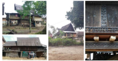
Gambar 3. Rumah Baghi di Desa Perapau

lima daya tarik destinasi wisata yang dapat dikembangkan dan yang perlu ditingkatkan pelayanannya. Selain daya tarik wisata pengembangan destinasi memerlukan perbaikan pada aksesibilitas, fasilitas umum, dan fasilitas pariwisata. Penjelasan daya tarik wisata dan pengembangan destinasi wisata adalah sebagai berikut: