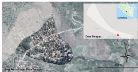
Gambar 2. Peta Desa Perapau

Data yang telah dikumpulkan lalu disusun untuk menjadi dokumen yang lengkap berupa peta desa, gambar kerja dan tiga dimensi rumah baghi, dan narasi yang melengkapinya. Pendampingan menghasilkan buku, pamflet, papan promosi, dan papan peta desa.