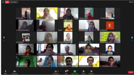
Gambar 1. Kegiatan penyampaian materi di pertemuan pertama

Language of Mathematics mengenai bahasa matematika yang penting tapi terkadang tidak semua guru matematika dapat menggunakannya dengan tepat. Selanjutnya, materi yang diberikan mengenai tentang filsafat pembuktian dalam matematika. Metode diskusi dan tanya jawab dilakukan saat penyampaian materi agar peserta dapat langsung berdiskusi dengan narasumber. Berikut ini adalah dokumentasi pelaksanaan sesi pertama.