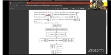
Gambar 3. Peserta mempresentasikan tugasnya

yang hadir. Kegiatan yang dilakukan adalah presentasi tugas pembuktian yang telah disusun oleh peserta. yang diwakili oleh 3 peserta saja. Berikut ini gambar kegiatan presentasi peserta.