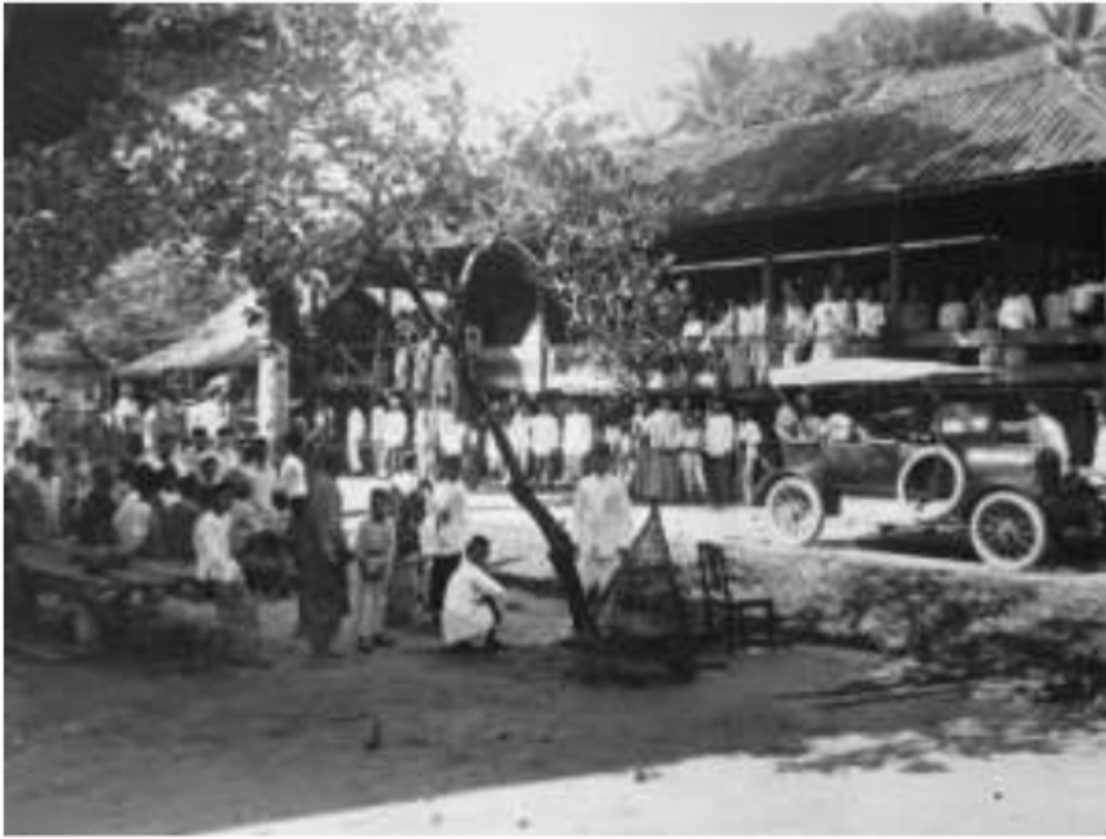
Gambar 41. Suasana keramaian di pedalaman Palembang. Judi, sabung ayam, dan lelang sebagai daya tariknya. Para pesirah dan kerio dari marga sebelah dusun banyak yang datang ke keramaian tersebut.

Arus urbanisasi dari uluan ke iliran , dalam catatannya dari pedalaman Palembang ke kota Palembang, pada masa kolonial, terutama tahun 1930-an, lebih banyak dilakukan oleh “orang-orang terdidik”. Mereka datang ke kota pada awalnya, lebih disebabkan oleh persoalan meneruskan sekolah. Mereka adalah anak-anak “pembesar” uluan paling tidak anak pasirah atau depati . Kedatangan mereka untuk sekolah dan nanti bekerja di kota Palembang, terutama untuk mengisi jabatan bawah pemerintah kota, gemeente 15 . Akibatnya, dalam kota pada “warga kota asli”,