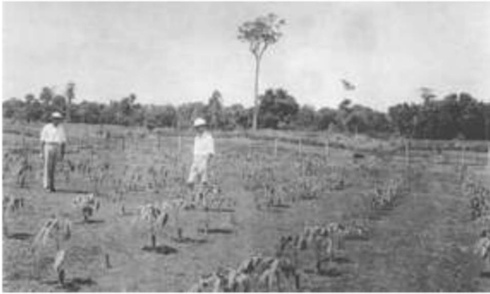
Gambar 8. Penanaman bibit karet yang diolah perusahaan asing di Tebenan, Betung sekarang ini, 1931.

Kenyataan ini, menyebabkan berubahnya orientasi para penguasa formal tradisional dari pemimpin kharismatik yang memiliki visi mensejahterakan masyarakatnya. Mereka yang pada zaman kesultanan bertindak sebagai pelindung dan pengayom di daerah uluan , berubah menjadi pemimpin yang mulai memperkaya diri sendiri. Keadaan inilah yang mulai memunculkan perlawanan-perlawanan yang disebabkan dari kebencian di kalangan masyarakat bawahan di daerah uluan . Perlawanan ini acapkali timbul dalam bentuk semacam “protes” atau membangkang dengan menghindari dari gawe raja . 25