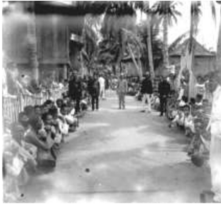
Gambar 43. Suasana pemilihan Pesirah atau Kerio di Pedalaman Palembang. Orang yang memilihnya cukup membentuk barisan memanjang di belakang atau di depan tempat ia berdiri. Pemilihan kepala daerah paling demokratis dalam sejarah di Sumatera Selatan, namun ditenggarai masuknya unsur uang ( money politic ) dianggap sebagai salah satu kelemahannya. Selanjutnya, pada masa kolonial pengangkatan Pesirah atau Kerio di Pedalaman Palembang berdasarkan pendidikannya.

pasirah yang datang dari uluan untuk bersekolah agar dapat menggantikan posisi bapaknya kelak di daerah uluan, justru dapat memanfaatkan kesempatan ini. Mereka akhirnya, menjadi elemen “warga kota asli” meskipun bukan berasal dari iliran , tetapi dari uluan . Selain sekolah rendah, sejak tahun 1927, untuk pertama kali di kota Palembang kemudian dibuka sekolah lanjutan MULO. Berbeda dengan sekolah rakyat lainnya, MULO hanya diperuntukkan bagi anak-anak kelompok pejabat pemerintah yang berlatar sosial bangsawan dan pasirah dari uluan. 27