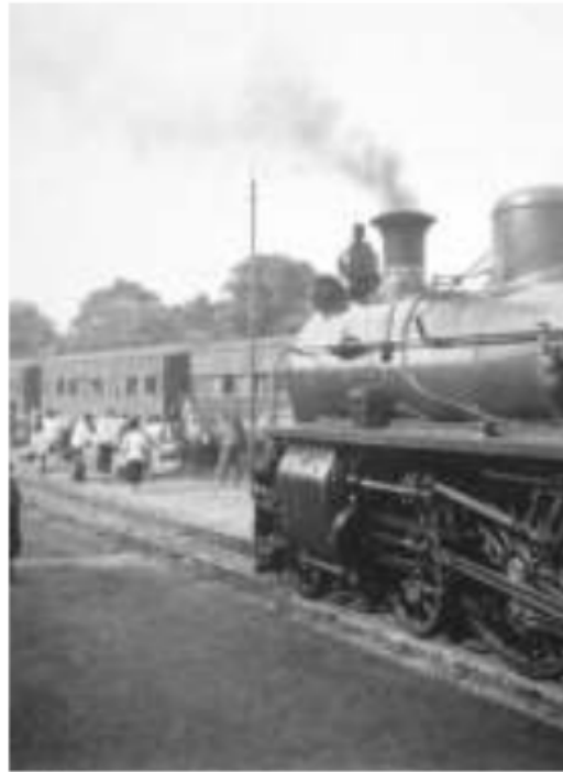
Gambar 40. Lokomotif dengan latar kesibukan penumpang di Stasiun Kereta Api Prabumulih, tahun 1932. Orang Uluan, pedalaman Palembang banyak yang bermigrasi ke Iliran, Kota Palembang. Salah satunya lewat pintu masuk jaringan rel kereta api yang diperkenalkan kolonial. Orang Komerling, Pasemah dan Rawas dapat dengan mudah pergi ke kota.

Belanda terhadap kesetiaan bangsawan iliran yang ditakutkan masih berafiliasi terhadap kaum sisa-sisa Kesultanan Palembang. 11 Tetapi keadaan sebaliknya, justru dialami oleh orang-