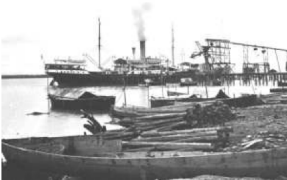
Gambar 15. Pemandangan industri perkayuan di sepanjang Sungai Musi dengan latar sebuah kapal komersil milik KPM