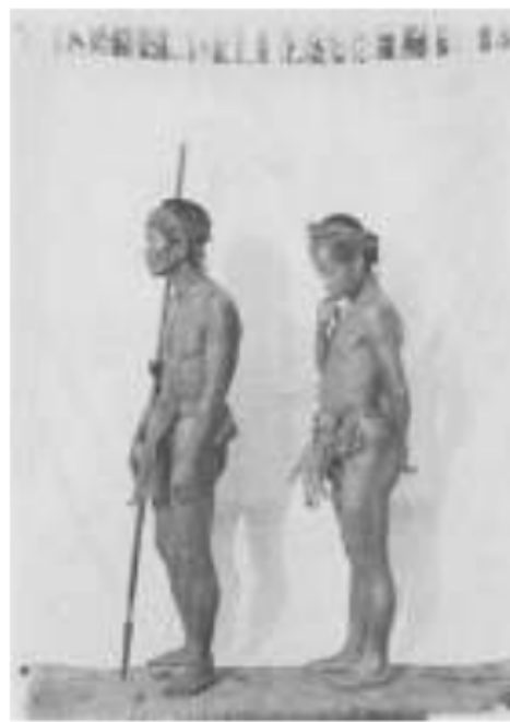
Gambar 29. Peralatan berburu Suku Kubu di Keresidenan Palembang, 1910.

berada di dalam rumah. Tanaman padi tidak dipupuk tetapi rumputnya disiangi. Selain bertani ladang, suku Kubu juga berburu binatang dan menangkap ikan di sungai. Di hutan tempat tinggal mereka masih bisa ditemukan binatang buruan seperti; kijang, rusa, napo atau kancil. Masih ada juga gajah dan ular tetapi binatang itu tidak mereka makan, karena tidak terbiasa sejak dari dulu. Pola perkawinan, biasanya diresmikan oleh para tetua masyarakat, tidak ada makanan khusus. Setelah menikah pasangan itu bisa tinggal di rumah orang tua si laki-laki, rumah orang tua si perempuan, atau membuat rumah sendiri.