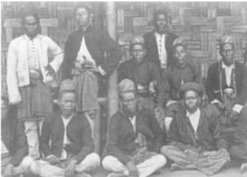
Gambar 7. Para pasirah uluan dari Afdeeling Rawas, 1930.

Hukum adat yang diakui ini tetap berjalan dengan sangat baik dalam sistem yang paling rendah yaitu marga. Marga menjalankan pemerintahannya secara otonom dengan dasar adat istiadat, baik susunannya ( semenstelling ), bentuknya ( inrichting ) maupun kewenangannya ( bevoegdheden ) yang berdasarkan hukum adat.