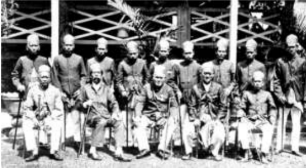
162 Gambar 42. Para pasirah dari pedalaman Palembang. Anak, keponakan, dan orang-orang kampungnya yang mengaku masih memiliki hubungan darah dengannya banyak yang bersekolah di Palembang.

Indies" mulai tahun 1890. 21 Fabrik snijverheid , yang ada di Plaju, Bagus Kuning, dan Sungai Gerong mampu memproduksi minyak 1.137.286 ton per-tahun dengan keuntungan sebesar 65 juta gulden. Tambang batu bara Bukit Asam, pada tahun 1930 mampu mendatangkan penghasilan sebesar 5 juta gulden dengan produksi batunya sebanyak 413.762 ton per-tahun. 22