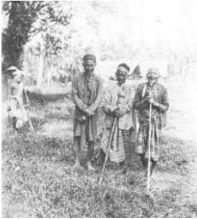
Gambar 25. Tetua Marga di pinggiran sungai Komering, 1920

bertapa, ia hanya berkemat-kamit dengan tujuan berkomunikasi dengan arwah leluhur, sang puyang . Jika ia dapat berhubungan dengan arwah leluhur ini, selanjutnya sang puyang akan menjelma kembali dalam raga sang pemuja tersebut. Setelah ia secara spiritual lahir kembali sebagai puyang , kemudian ia kembali ke dusunnya untuk mengadakan pertemuan dengan kerabatnya. Diilhami dupa, dalam keadaan transeden , kesurupan, dalam kesempatan tersebut, sang puyang yang masuk ke dalam tubuhnya memperkenalkan jati dirinya kepada para pengikutnya. Demikian si dukun memperoleh kekuatan gaibnya.