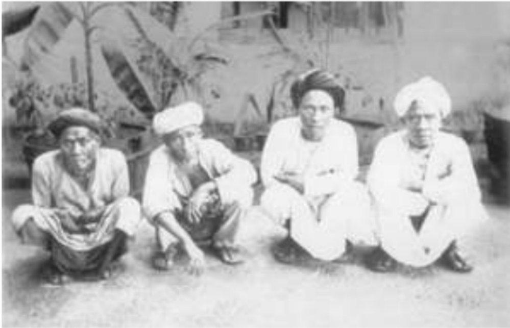
Gambar 9. Para Haji yang baru datang dari Mekkah, mereka termasuk dalam kelompok kaum mudo , 1930.

Pendudukan Jepang di Keresidenan Palembang dimulai sejak serangan tanggal 14 Februari 1942. Pelabuhan udara Talang Betutu, merupakan sasaran pertama yang harus dikuasai Jepang dalam mengalahkan tentara Belanda di Keresidenan Palembang. Secara politis, pendudukan Jepang dalam bidang penyelenggaraan pemerintahannya menyesuaikan dengan kepentingan Angkatan Perang Jepang yang sedang terlibat Perang Dunia II. Pemerintahan Pendudukan Jepang bekerja dengan sangat cepat, sebab hanya dalam hitungan sepuluh hari setelah mereka masuk ke Palembang, pada tanggal 25 Februari 1942 telah keluar segala aturan-aturan tentang pelaksanaan pemerintahan di Palembang dan sekitarnya.