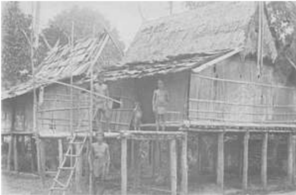
Gambar 28. Rumah Suku Kubu di Rawas, Onderafdeling Lubuk Linggau, Keresidenan Palembang, 1910.

Suku Kubu yang selama menetap dan terpengaruh oleh kebudayaan orang Melayu biasanya mempunyai pemimpin setempat yang disebut depati . Selain itu mereka masih memandang tokoh besale , dukun, sebagai pemimpin spiritual yang disegani. Ada juga kelompok-kelompok yang ahli dalam masalah adat dan kemasyarakatan serta menguasai pengetahuan esoteris warisan nenek moyang mereka, tokoh ini disebut malim , tetapi perannya juga bisa dirangkap oleh besale .