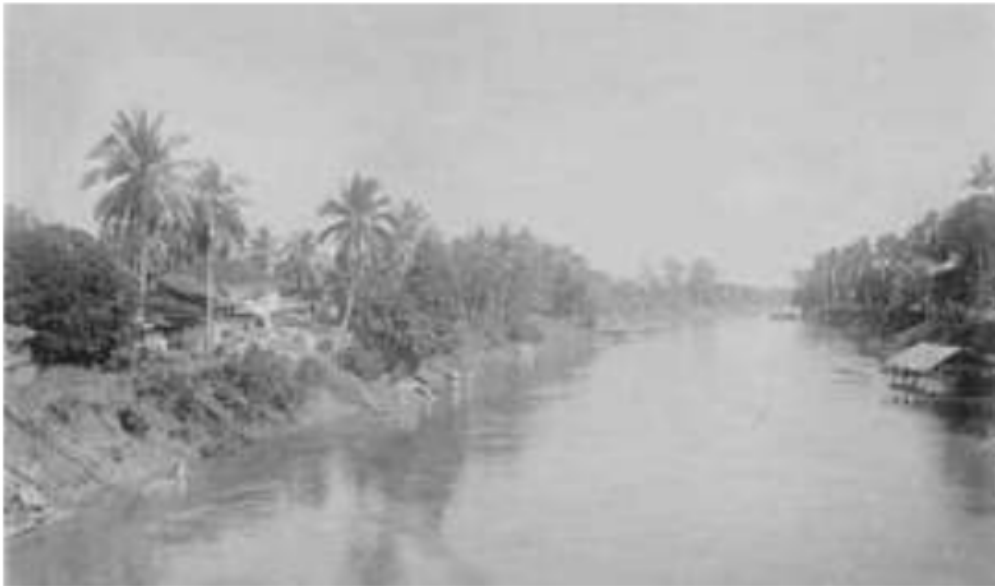
Gambar 26. Sungai Batang Rawas di Sarolangun, 1879.

Musi Sekayu, suku ini terutama tinggal di Marga Babat Toman, Banyu Lincir, Sungai Lilin, dan Banyuasin Dua dan Tiga. Umumnya mereka tinggal di dataran rendah yang diselingi rawa-rawa dan berada di daerah aliran sungai. Sungai terbesar adalah sungai Musi yang memiliki banyak anak sungai. Mata pencaharian pokoknya adalah bertani di sawah dan ladang. Mereka masih percaya terhadap berbagai takhyul, tempat keramat dan benda-benda kekuatan gaib.