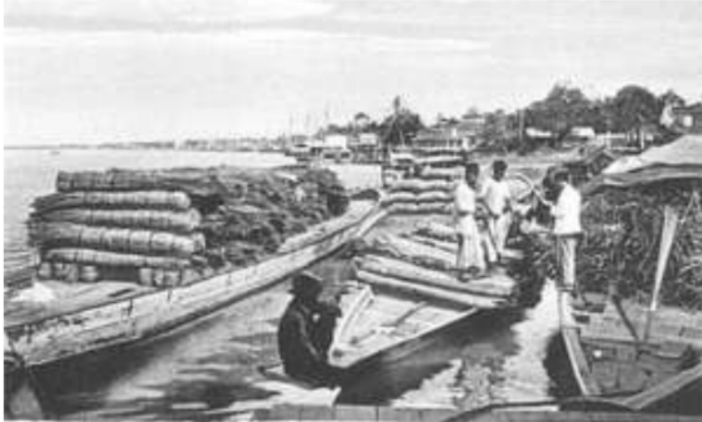
Gambar 16. Kesibukan Penjualan Rotan dari Uluan di Dermaga Boom Baru Palembang, 1920

kayu ditebang kemudian dihanyutkan dibawah ke ilir sungai, di ilir sungai sudah siap pembeli, toke tadi, biasanya pemuka setempat atau pedagang luar yang kemudian mengadakan kontak dan menawar dengan saudagar besar dari Palembang.