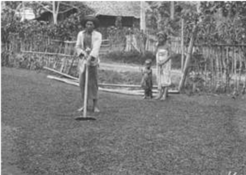
Gambar 17. Petani kopi tradisional menjemur kopinya di alam terbuka, uluan Pasemah, 1920

karena perhubungan terbuka waktu itu lebih mudah lewat dataran tinggi yang menurun ke Keresidenan Bengkulu. Baru setelah jalur Bukit Barisan menuju ke Keresidenan Palembang lewat Hulu Musi terbuka, kopi Arabica mulai mendapat tempatnya karena meningkatnya persaingan. Menariknya, harga kopi ini, kemudian memicuh penanaman kopi Arabica di dataran tinggi Bukit Barisan, daerah Uluan Palembang lain yakni Basemah Lebar di Onderafdeeling Lematang Hulu Lahat dan di Semendo pada Onderafdeeling Lematang Hilir Muara Enim. Akibatnya, Lahat dan Muara Enim muncul sebagai pusat perdagangan kopi di uluan.