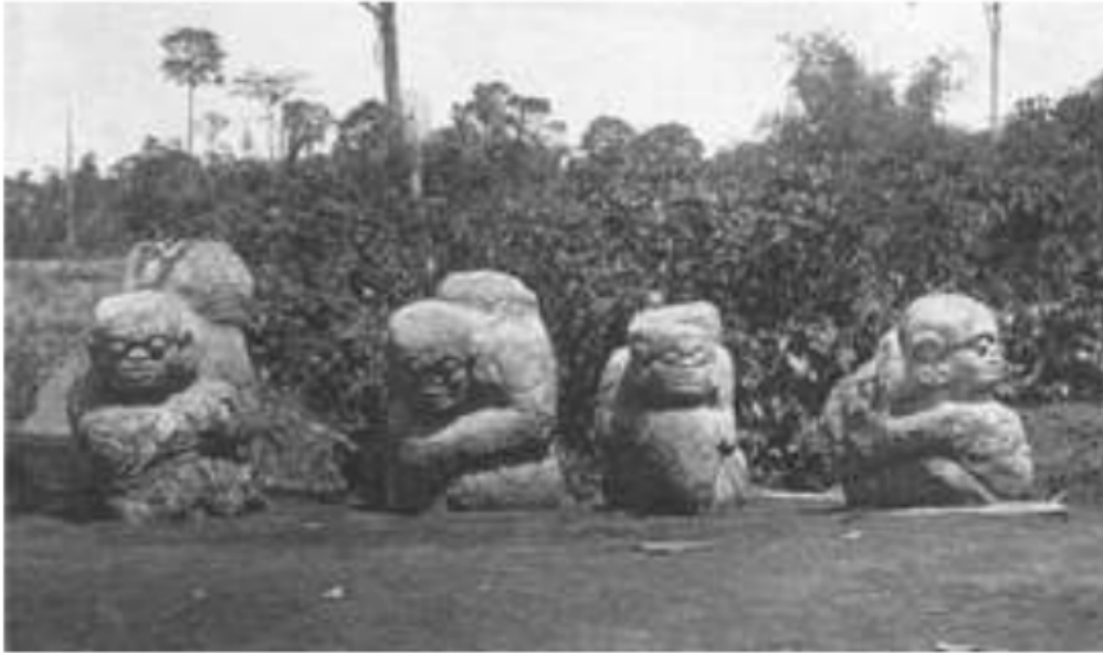
Gambar 33. Arca-arca megalitik manusia Pasemah, 1920.

Menariknya, hampir semua suku di Onderafdeeling Lematang Hilir Muara Enim ini memiliki bahasa yang sama dengan tekanan pada huruf terakhir yang berbunyi “e”. Namun khusus untuk suku Belida terdapat perbedaan, karena suku ini memiliki akhiran “a” yang dipengaruhi oleh bahasa Palembang Melayu yang juga berakhiran “a” atau “o”.