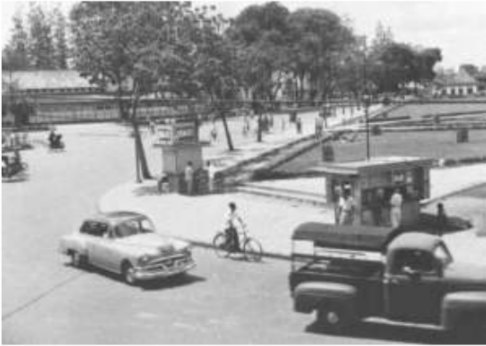
Gambar 50. Keadaan alun-alun Masjid Agung Palembang, 1953. Mobil di jalanan dengan latar kios dan beca, pemilik kios dan tukang beca pekerjaan yang banyak dilakukan orang-orang uluan di Kota Palembang

tradisional. Tinggal di kota, bagi penduduk pendatang dari pedalaman Palembang, merubah corak pekerjaannya, jika di desa, lapangan pekerjaan tersebut hanya beberapa macam saja, namun ketika di kota pilihan mata pencarian lebih banyak dan terbuka. Tetapi tinggal di kota harus dapat menggunakan bakat dan pengetahuan, kalau tidak akan sulit untuk memasuki dunia kerja yang lebih baik lagi.