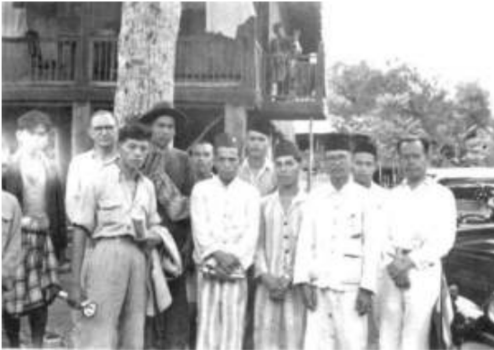
Gambar 45. Si Uluhan yang berhasil di perkotaan dengan menjadi pegawai rendahan Belanda pulang menjenguk dusun kampung halamannya, tahun 1937. Perhatikan latar foto yang memuat mobil sebagai simbol "kekayaan" dan "kesuksesan" mereka.

janganlah gampang berbahasa Belanda. Menurut orang iliran , kalau orang uluhan dapat seperti orang Jawa yang telah menjadi profesor, doktor dan inspektur atau officer serta arohicer dan sebagainya yaitu di Eropa dan Jawa, mereka khawatir kota Palembang dapat dibolak-balikan oleh orang-orang ini, sedangkan orang Jawa yang begitu tinggi jabatan pekerjaan Eropanya tidak ada seperti orang uluhan tersebut. Dalam perspektif orang iliran , orang uluhan mesti berlangganan majalah-majalah atau surat-surat kabar Eropa seperti Java Bode , het Nieuws van de Dag , Locomotief , atau Batavia Nieuwsblad , agar dapat mengetahui bagaimana pangkat orang-orang yang lebih tinggi dari orang-orang uluhan tersebut.