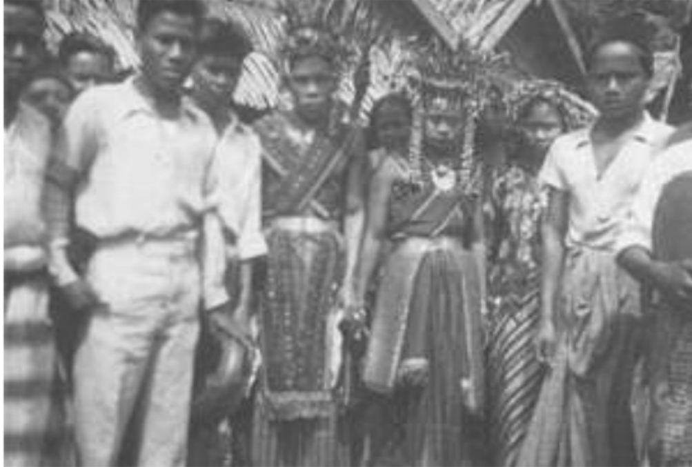
Gambar 21. Penganten uluhan dengan latar belakang rumahnya beratap rumbia, di Komerling, 1930.

1 considered, a Malay, and replied, with some emotion: Malajoe tidak, Sir, orang oeloe betoel saio. No Malay, Sir, I am a genuine, aboriginal countryman”.