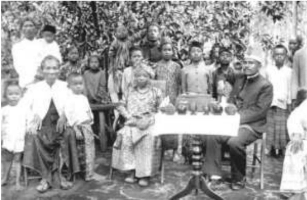
Gambar 46. Pernikahan pengantin Palembang. Si Iliran dengan menantu Arabnya.

maksudnya mahar yang diberikan hanya sebatas “ pemanis ” dan “ pembagus ” dari sebuah perasaan gengsi si orang tua pengantin iliran tersebut. “Emas” atau uang asap dalam perkawinan ini, kadang hanya diberikan jumlah terkecilnya, sementara jumlah terbesar yang “wajib” disebutkan ketika akad nikah tadi ternyata, akan dikembalikan lagi karena emas dan uang asap tersebut pinjaman pada keluarganya yang lebih kaya. Kelihatan bagi si kayo lamo , di “ luannyo ”, didepannya bagus, namun di “ burinyo ”, di belakangnya jelek.