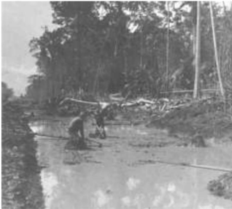
Gambar 14. Para penebang pohon dalam hutan membuat parit untuk menarik kayu tebangannya dari dalam hutan ke sungai, 1930.

Pertama untuk daerah Uluan Palembang sebelah selatan yang meliputi wilayah Ogan Ulu di Onderafdeeling Lematang Hilir Muara Enim, Onderafdeeling Lematang Ulu Lahat, dan Kikim produksi kapas ulu terpusat di tanah talang, karena minimnya tanah alluvial. Sementara, di Uluan Palembang sebelah utaranya hanya terbatas sepanjang Lematang Hilir saja. Di Lematang Hilir masyarakat menanam kapas ulu di bagian tanah alluvial yang memang cocok untuk kapas dengan produksi utama dari daerah ini. Munculnya produksi kapas ulu inilah yang kemudian menyemarakkan jalur perdagangan di sungai Lematang dari ulu , Uluan Palembang ke daerah iliran , Palembang pada tahap pertamanya.