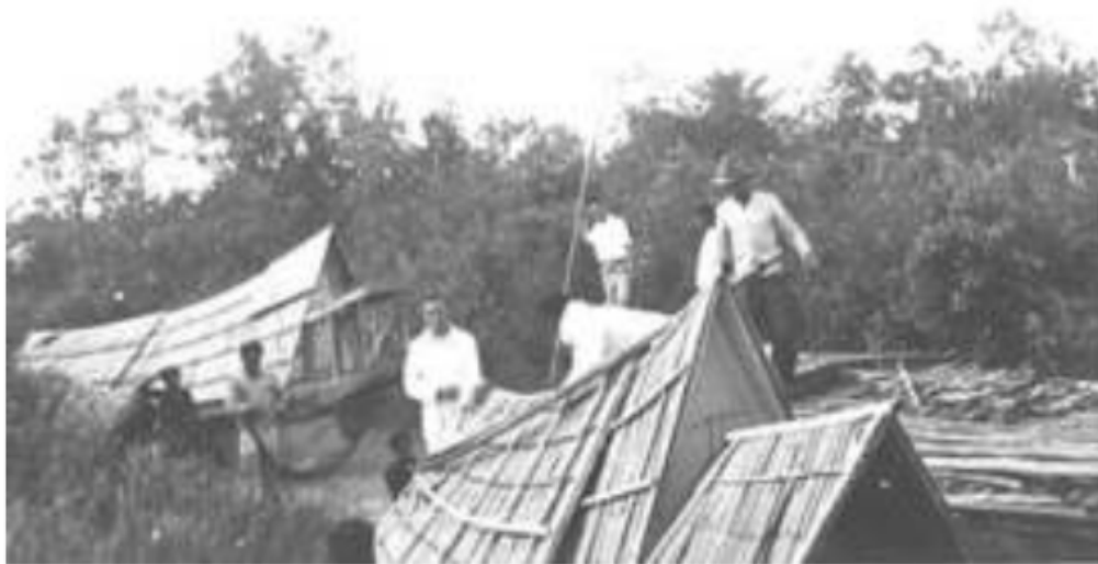
Gambar 11. Perahu Kajang di sungai Komering, 1920. Perahu yang juga tempat tinggal untuk beberapa hari selama perjalanan yang digunakan untuk berlayar dari Ilir ke Ulu dan sebaliknya.

Pada dasarnya, daerah yang disebut Iliran Palembang, secara geografi ekologis terbelah menjadi dua yakni Iliran Palembang yang berada di daerah selatan dan Iliran Palembang yang berada di bagian utara. Dalam mencari bentangan alam yang memisahkan secara kasat mata secara fisik dari batasan geografi dua bagian Iliran Palembang ini akan kita lihat dalam pengaruh ekosistem geografi ini terhadap teknologi hidup yang dikembangkan untuk memenuhi kebutuhan dasar mereka.