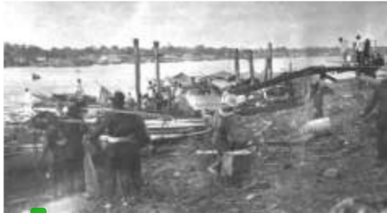
5 Gambar 3. Potret kesibukan mengangkut barang dagangan di tepian Sungai Musi Palembang

Selain secara ekologis, Palembang juga diuntungkan dengan adanya ketersediaan sungai yang representatif dalam pengembangan teknologi transportasi, sehingga dengan demikian semua kontak perdagangan dengan kota-kota lain di luar aliran sungai serta daerah-daerah pedalaman aliran sungainya dapat dilakukan dengan baik. Melalui jalur perdagangan seperti ini, jalur pertukaran barang tercipta sedemikian rupa sehingga segala dan semua kebutuhan hidup penduduknya dapat dipenuhi.