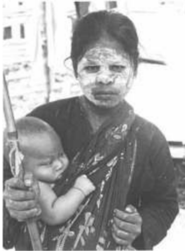
Gambar 30. Wanita Uluan menggendong anak dengan bedak yang terbuat dari beras yang dihaluskan, Muara Enim, 1925.