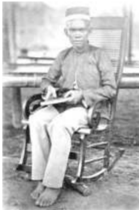
Gambar 44. Potret salah seorang kaum terdidik uluan yang berasal dari Soeroelangoen Distrik Rawas.

Bagi orang iliran , orang-orang Palembang asli dalam komposisi “warga kota asli”, memandang penduduk yang berasal dari uluan , orang-orang pendatang dari pedalaman Palembang, bagaimanapun pintar dan majunya orang uluan bagi orang iliran , tetap dianggap “belum memiliki apa-apa”. Orang iliran tetap menganggap bahwa uluan hanya bersifat dapat memuji dirinya sendiri dan ingin memashyurkan namanya, menjadi terkenal, namun hanya untuk kalangannya saja, orang uluan , bukan saja untuk orang uluan di Palembang, tetapi sampai ke semua uluan di Keresidenan Palembang. Kadang bagi orang iliran , orang uluan ingin menganggap dirinya “paling pintar sendiri” dari orang lain, sebab orang Palembang belum ada yang menjabat seperti dia.