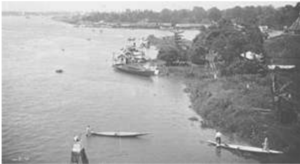
Gambar 5. Muara Sungai Ogan, di Air Musi, Kertapati, 1930

4 “taklukan” ini masih memiliki kekuatan-kekuatan yang otonom dan tetap merdeka. Palembang sebagai daerah pusatnya ini hanya butuh sebuah “pengakuan” saja, dan uluhan-uluhan itu “mengakui” dalam bentuk konsep ritual “ milir sebah ” tadi. Sekali-sekali, terutama sekali setahun dalam bulan ramadhan, menjelang lebaran, milir sebah , mengilir datang ke pusatnya di Palembang, sambil membawa barang-barang upeti gegawaan, hasil bumi daerah uluhan , untuk dipersembahkan kepada penguasa di pusat tadi. Sebagai imbalannya, pusat nanti akan memberi perlindungan ke pada daerah-daerah uluhan yang mengadakan milir sebah .