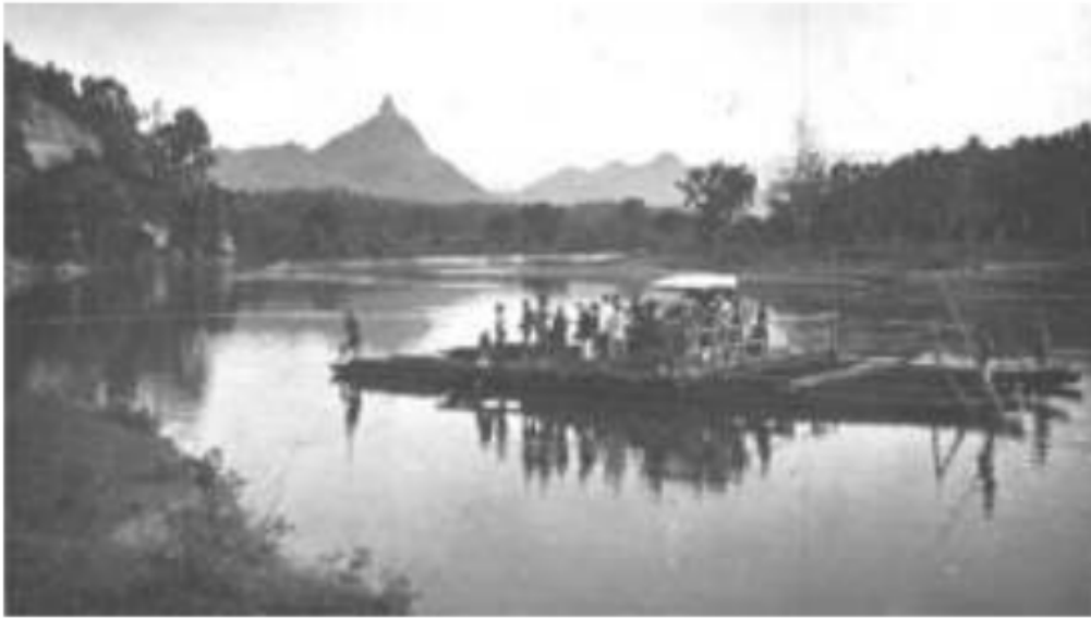
Gambar 12. Sebuah mobil di atas angkutan penyeberangan Sungai Lematang dengan latar Bukit Serelo. Lambang oejan mas di pedalaman Palembang.

mengalami pembusukan sebelum berbuah. Akibatnya, tanaman kapas ulu hanya diproduksi pada Uluan Palembang dengan tanah yang agak melandai, turun dari dataran tinggi ke dataran menengahnya.