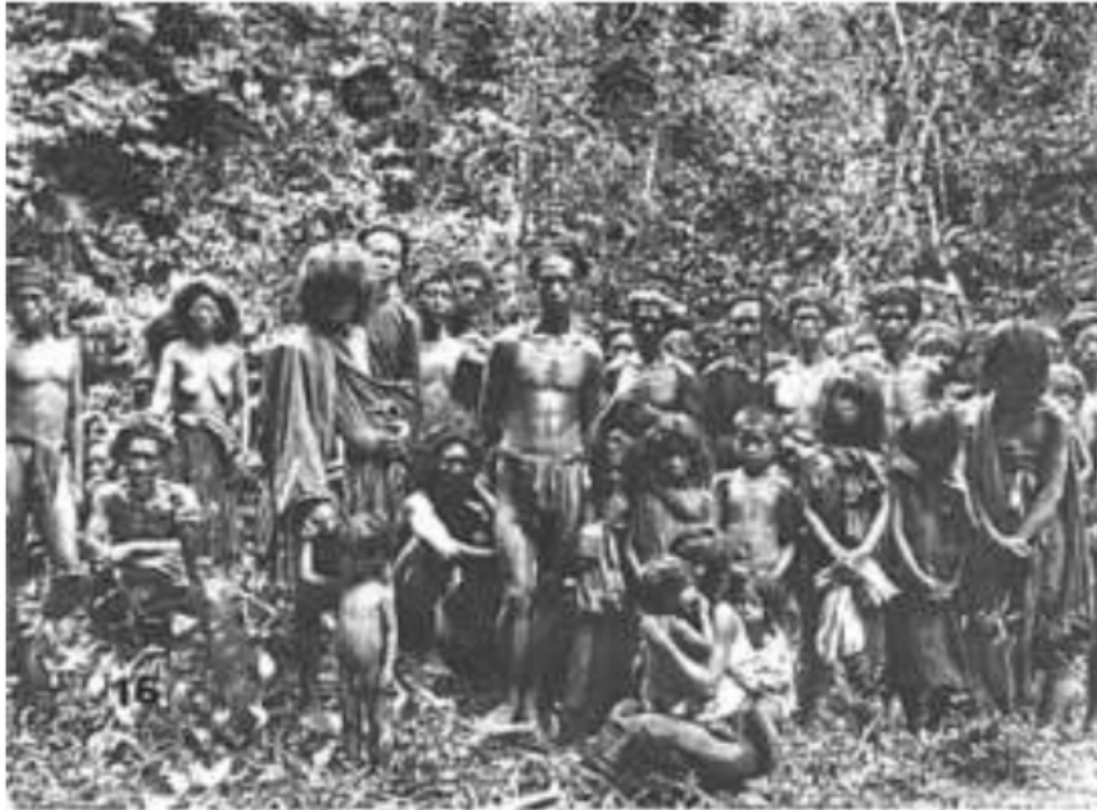
Gambar 27. Suku Kubu di Air Itam, Onderafdeeling Lematang Ilir, Keresidenan Palembang, 1920

berpindah-pindah di sekitar daerah aliran sungai Musi, sungai Rawas, sungai Lalan dan sungai Banyulincir. Kesatuan hidup mereka dalam keluarga inti cukup penting, tetapi masyarakat pengembara ini lebih senang hidup mengelompok dalam lingkungan keluarga orang tuanya. Setiap kelompok dipimpin oleh seorang laki-laki senior yang dianggap bijaksana dan berpengalaman. Masyarakat ini umumnya masih menganut sistem perkawinan endogami kelompok tetapi disertai dengan larangan kawin saudara sekandung dan saudara sepupu pihak ibu.