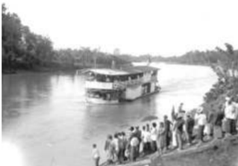
Gambar 38. Kapal penumpang "Hong Sing Bie" milik kongsi Cina Berlayar jauh ke uluan sampai di sungai Enim, Muara Enim.

Pedagang-pedagang Cina, mampu bertindak sebagai agen yang mengandalkan pengalaman-pengalaman mereka sebagai pedagang tangguh. Warga kota ini, hampir semuanya menerjunkan diri dalam berbagai kegiatan dagang, mulai dari penunggu warung atau toko, pedagang kecil-kecilan, pengecer kebutuhan sehari-hari, sampai kepada agen penyalur komoditas kopi dan karet sekaligus eksportir dan importirnya yang memiliki jaringan usaha luas ke luar kota Palembang.