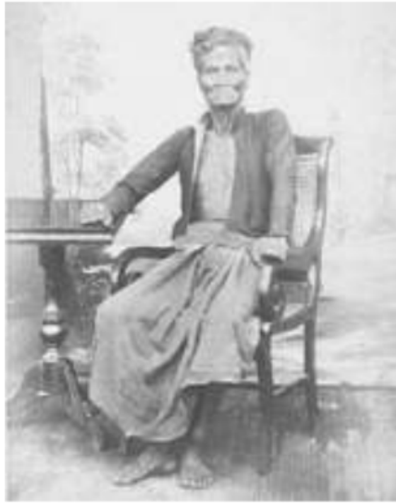
Gambar 6. Pangeran Goetika, salah satu Pasirah Uluan yang berasal dari Pasemah, 1867.

Melalui Regeeling van de Imheemsche Rechtspraak Buitengewesten (aturan pengadilan asli di daerah seberang) tahun 1923 jo Besluit Residen Palembang tanggal 23 Oktober 1933, maka diadakan aturan untuk pengadilan dalam daerah uluan Keresidenan Palembang ke dalam tiga tingkatan, yaitu :