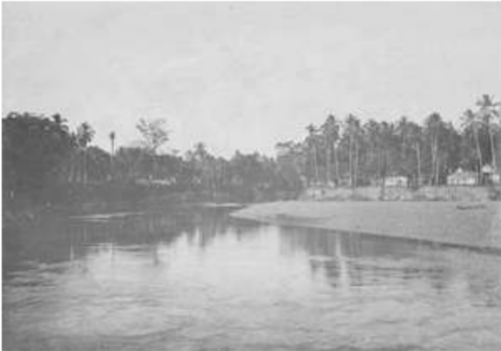
Gambar 24. Sungai Ogan di Baturaja, 1935. Dari sinilah bermula suku Ogan menyebar dan menjadi sub-sub suku lainnya.

Ketiga, mereka 1 yang berasal Gunung Kabah di bagian utara Bukit Barisan pada Keresidenan Palembang, yang terletak di antara Onderafdeeling Rejang Kahpayang 14 dan Onderafdeeling Lubuk Linggau 15 , mereka menjadi suku Rejang yang menuruni dan menelusuri sungai Rawas yang menjadi Suku Rawas, sungai bagian Musi sebelah hulu yang menjadi Suku Musi Sekayu, sungai Lematang bagian Ilir melewati Sungai Keruh dan Penukal dan menjadi suku Penukal Abah 57