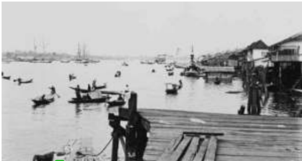
5 Gambar 1. Pemandangan dari atas sebuah dermaga Sungai Musi dengan perahu dan kapal yang ilir mudik berlayar dari ke uluan pedalaman sampai ke luar negeri.

yang ditulis dalam sebuah surat kabar lokal 5 , serta kenyataan bahwa Palembang sudah lama dikenal sebagai jembatan penghubung jaringan perdagangan pusat-pusat perniagaan Hindia Belanda bagian barat. Julukan Palembang dengan gelar “ de grootste handelstad van Sumatra ”, membuktikan hal tersebut. Palembang dan daerah sekitarnya, Keresidenan Palembang, dikenal juga sebagai “ state of production, commerce and trade ”, untuk membandingkannya dengan wilayah Sumatera Timur yang disebut sebagai “ state of estates ”, 6 membuktikan bahwa semua urusan bisnis sangat dominan di Palembang. Oleh karena itu, terhampar kenyataan bahwa kota ini sangat menguntungkan dan berlaku ramah, mulai para perusahaan besar, usaha orang-orang terkaya pribumi maupun Cina, sampai bagi usaha orang kecil sekalipun. Kota ini dianggap sebagai tempat menumpuk uang. Tidak ada kota di Sumatera, dapat bertindak dan berlaku seperti Palembang.