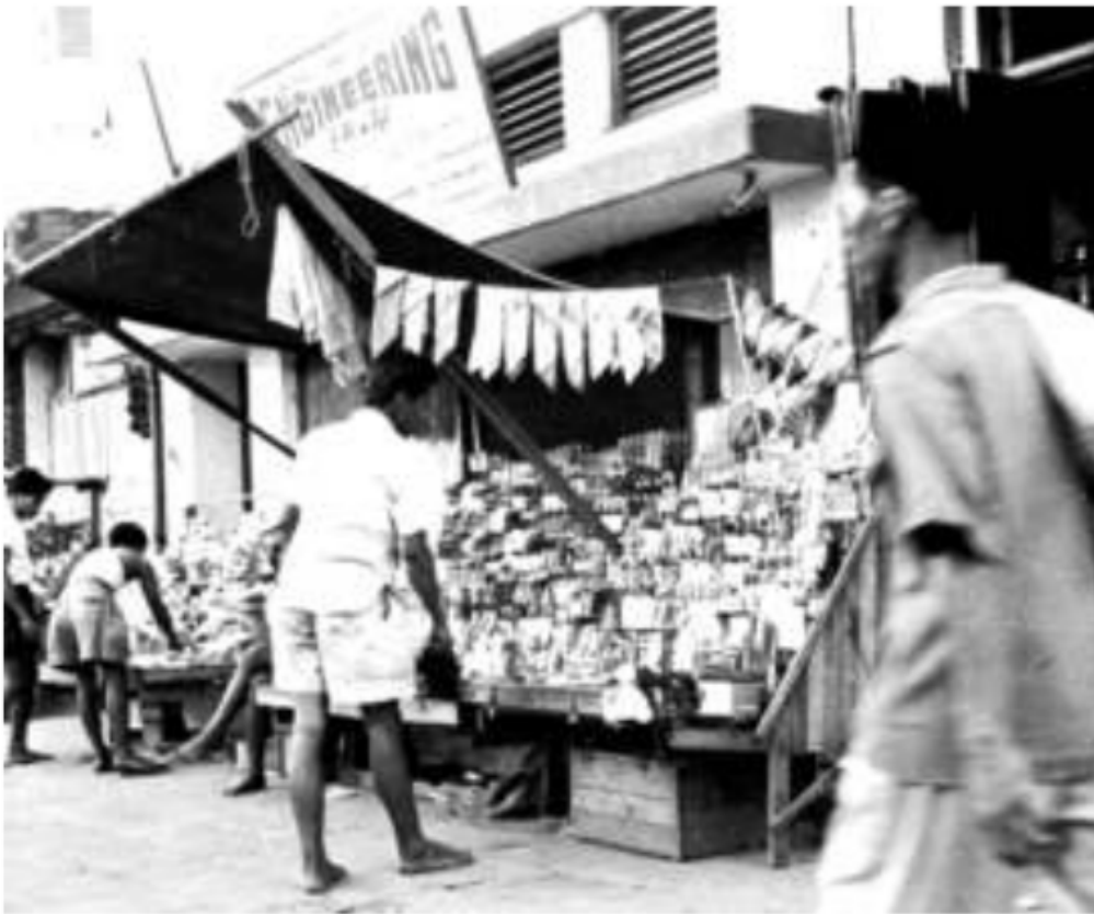
Gambar 49. Pedagang kaki lima salah satu pilihan pekerjaan tanpa skill yang dilakoni orang uluan di Kota Palembang, 1955.

datangan ini, sering menimbulkan persoalan-persoalan baru untuk dapat menyesuaikan diri dengan cara hidup yang penuh persaingan dan liku-likunya. Pada mulanya banyak mereka yang menyangka berangkat dari desa dapat mencari pekerjaan dengan mudah di kota. Bagi yang memiliki skill seperti sopir, montir, dan tukang tidak terlalu memiliki kendala serius untuk hidup di kota, tetapi untuk mereka yang tidak memiliki pengetahuan, banyak yang menemui kesulitan dalam perjuangan mencari nafkah untuk hidup di kota, apalagi bagi mereka yang belum terlatih dalam penghidupan diperkotaan. Akibatnya, banyak yang kembali ke tempat semula di desa atau mencari modal un-