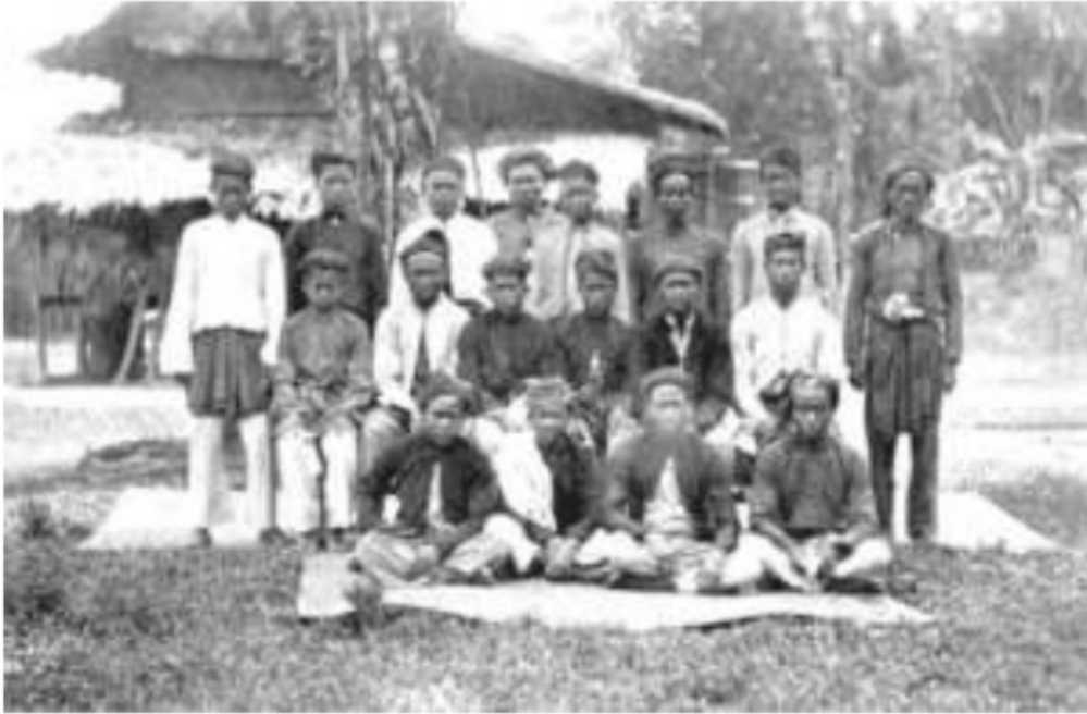
Gambar 47. Potret bujang, laki-laki yang belum menikah anak para pembesar dari pedalaman Lesoeng Batoe, Rawas dengan latar belakang sekolah desanya. Mereka melanjutkan sekolah yang lebih tinggi lagi ke kota, dan banyak yang menjadi si uluan yang berhasil hidup di kota zaman kolonial.

diri sebagai sebuah “kelas” baru perkotaan yang hidupnya walaupun masih dibawah “warga kota asing”, orang-orang Barat, Eropa dan Belanda, namun di atas rata-rata “warga kota asli”, dari komunitas Palembang asli, si orang iliran .