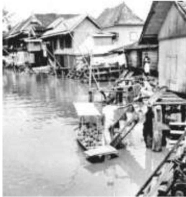
Gambar 48. Pedagang Duren dari uluan menjajakan barang dagangannya berperahu di anak-anak sungai Palembang, 1947.

keadaan yang memiluhkan, akibatnya muncul pembagian ruang-ruang rumah “penduduk asli” Kota Palembang. Rumah panggung mereka dibagi dalam kamar-kamar. Ironisnya, penambahan kamar-kamar untuk tempat penyewaan tersebut dilakukan di kolong rumah mereka. Persewaan rumah kolong ini yang makin menyebabkan terciptanya kesemrawutan kota. Beberapa keluarga “ tumpakan ” berkumpul dalam satu rumah, hidup berdesak-desakan dan banyak mempengaruhi kesehatan masyarakat kota. Selain itu, mengalirnya masyarakat “pendatang” dari pedalaman yang tidak diimbangi dengan tersedianya perumahan, menyebabkan terjadinya penyerobotan-penyerobotan lahan dan pendirian rumah-rumah liar. Hal semacam ini dapat menimbulkan akibat yang jalin-menjalin, dan berujung pada persoalan keamanan kota, yaitu muncul tindak kejahatan.