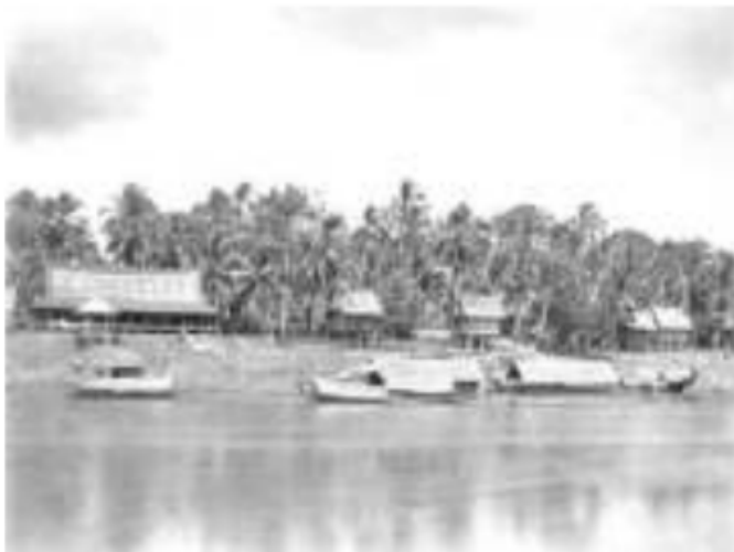
Gambar 35. Gambaran "Pedagang Keliling" dengan perahu kajangnya di sebuah Dusun Teluk Bingin, Rawas

Atung Bungsu diberi nasehat oleh adiknya agar meneruskan perjalanan ke ulu sungai Musi, masuk ke aliran sungai Batanghari Sembilan untuk menjumpai negeri Dunia Keling dengan dikasih timbangan emas oleh adiknya tersebut. Atung Bungsu diberi pesan tambahan, jika ia sudah mencapai sebuah daerah pertigaan yang merupakan pertemuan dua buah sungai, ia harus menimbang kedua air tersebut, di mana jika salah satu air memiliki timbangan yang lebih berat, maka ia harus menempuh dan melayari air sungai tersebut. Atung Bungsu meneruskan perjalanan, dan setelah dipertigaan tersebut, ia memilih dan menelusuri sungai Lematang yang airnya banyak terdapat ikan semah 70 , sehingga daerah ditepian sungai Lematang, di mana ia kemudian memutuskan untuk tinggal dan mendirikan pemukiman ini disebut dengan nama Besemah , namun orang luar lebih menyebutnya dengan nama Pasemah.