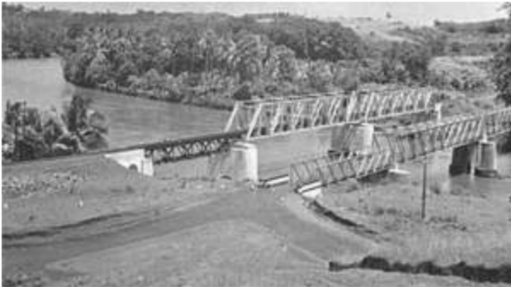
Gambar 32. Sungai Lematang, 1935.

Pada dasarnya, kelima suku tersebut mendiami tepian sungai Lematang. Sungai Lematang memiliki anak sungai yakni sungai Enim, sungai Penukal dan berakhir alirannya di sungai Belida yang merupakan perbatasan langsung dengan sungai Musi. Suku Belida dan daerahnya memiliki kesamaan dengan suku Ogan Pegagan di Onderafdeeling Ogan Ilir yang dimasukkan sebagai daerah kepungutan pada zaman Kesultanan Palembang.