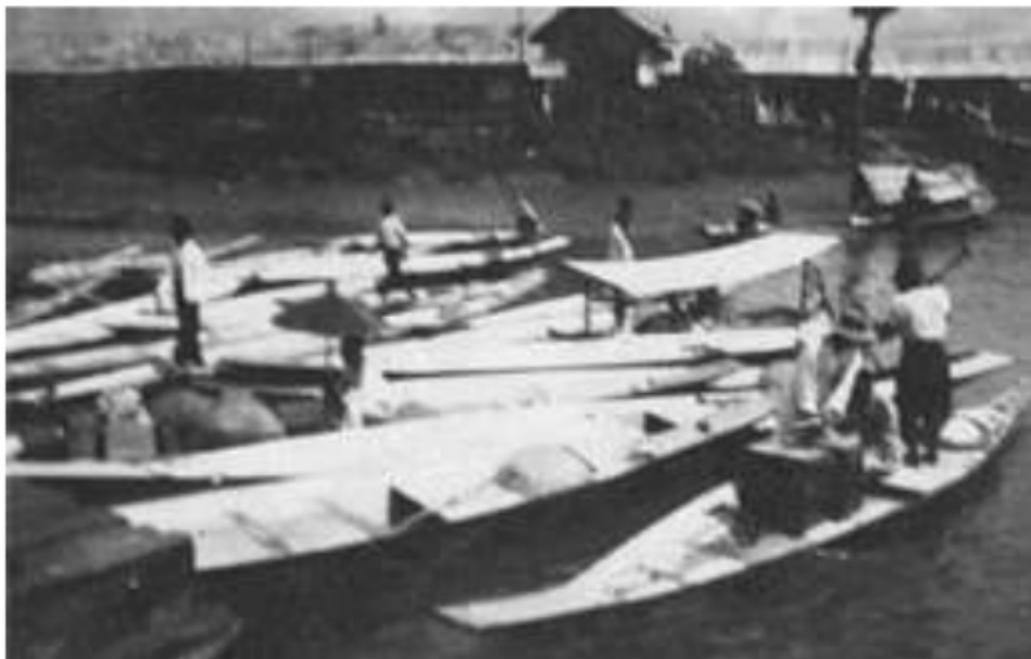
Gambar 4. Alat pengangkutan tradisional, perahu, baik di Ilihan Palembang maupun Uluan Palembang

Palembang dengan letaknya yang strategis ini, mampu “menguasai” dan memiliki pengaruh besar ke daerah pedalaman-nya cukup dengan mengembangkan apa yang disebut dengan politik kebudayaan dalam bentuk “dayung”. Masyarakat di daerah pedalaman-nya yang cenderung kolektif, namun terpecah berai secara lingkungan pemukimannya, di masa lalu memiliki penghubung tetap yang berupa kepandaian para pendayung yang dimiliki utusan kerajaan atau kesultanan yang terletak di daerah ilirannya, Palembang. Para utusan ini, hanya dengan berkelana di daerah pedalaman, uluan sungainya, dengan membawa lambang-lambang dan piagam raja sebagai simbol untuk mendapatkan pengakuan kekuasaan dari pembesar uluhan yang masih merdeka ini. Dengan cara demikianlah, maka “kehadiran” raja tetap terus berjalan di atas aliran sungai-sungai yang sekaligus memiliki fungsi sebagai arena lalu lintas ketatanegaraan. Keadaan ini berlangsung, sejak masa Sriwijaya sampai Kesultanan Palembang.