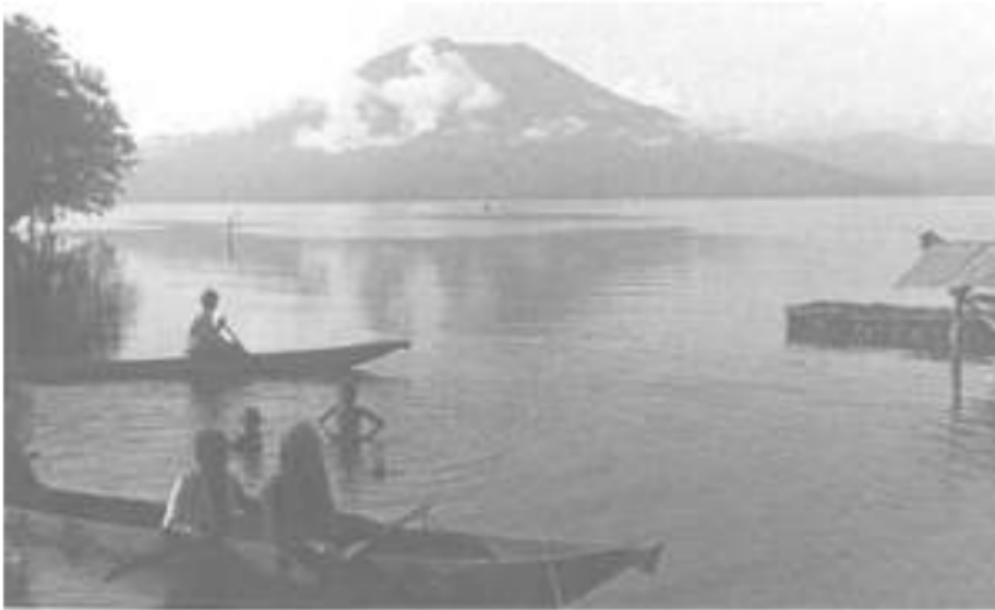
Gambar 22. Gunung Seminung dengan perahu di Danau Ranaunya, 1920. Gunung ini dianggap tempat pertama Suku Komerling, Ranau, Daya dan Aji berasal.