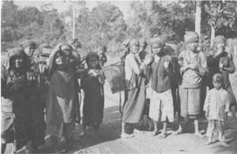
Gambar 20. Wanita uluan ikut membantu suami bekerja di sawah dan ladangnya, Muara Enim, 1935.

bagian ulu. Jadi, mereka yang berdiam di ilir sungai disebut wong ilir , orang iliran , sementara mereka yang tinggal di bagian sebelah ulu sungai disebut wong ulu , orang uluan . Artinya, mereka yang tinggal di ilir sungai Musi adalah orang iliran , sementara masyarakat yang bermukim di ulu sungai Musi dengan delapan anak sungai besarnya, dinamai orang uluan .