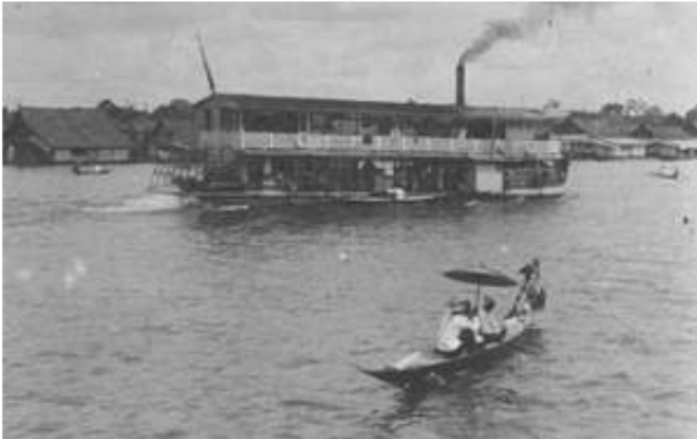
Gambar 2. Perahu tambangan dengan latar kapal uap di perairan Sungai Musi, 1935.

Kota Palembang tidak saja bertindak sebagai ibukota keresidenan secara politis, tetapi sekaligus “ibukota tidak resmi ekonomi” dari perdagangan untuk seluruh wilayah keresidenan. Sebagai ibukota dagang, Palembang memiliki letak strategis karena terhubung dan berhubungan secara luas dengan daerah-daerah lain yang ada disekelilingnya. Kota ini menjadi sentra dan penyaji utama dalam perhubungan tersebut, baik lewat jalan air maupun jalan darat. Segala hasil bumi yang datang dari daerah-daerah yang ada disekelilingnya, seperti getah para atau karet, kopi, jelutung, kapas, damar dan sebagainya, semuanya lebih dahulu mesti dikumpulkan di kota tersebut.