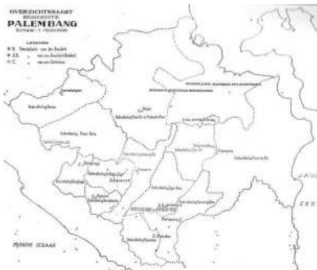
Gambar 37. Peta pembagian afdeeling dan onderafdeeling dalam Keresidenan Palembang