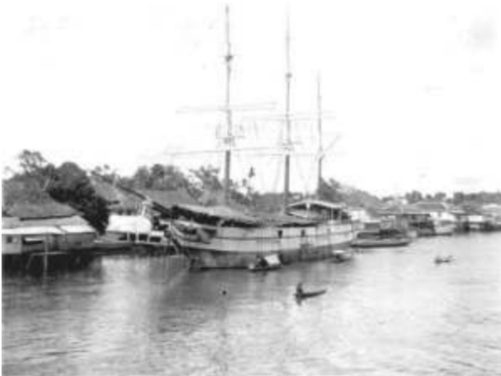
Gambar 39. Sebuah kapal pedagang Arab masuk sungai Musi dari pelayaran di pantai Sumatera, 1905.

lainnya, dalam pertengahan abad ke-19 juga tidak mau kalah dengan orang-orang Cina, mereka mendominasi perdagangan kain dan tekstil serta kapal dan perusahaan kayu. 7 Salah satu perusahaan besar yang dimiliki warga kota yang berasal dari golongan ini adalah perusahaan Said Aboe Bakar bin Ahmad yang bergerak dalam usaha tanaman tebu dan industri gula dipinggiran kota. Walaupun menjelang abad ke-20, para pengusaha Arab ini mengalami kemunduran karena tekanan pemerintah kolonial dengan menjalankan kebijakan diskriminasi yang tidak memperbolehkan mereka untuk berdagang memasuki daerah pedalaman, namun ada sedikit yang dapat bertahan sampai pertengahan abad ke-20 seperti firma Assegaf dan firma Alimoenar, P.T. Ali yang bergerak pengergajian kayu. 8