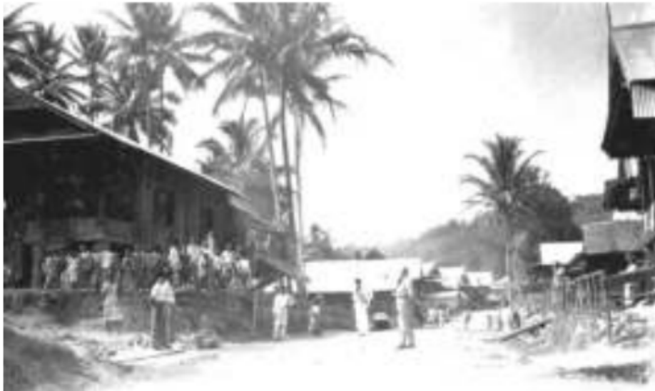
Gambar 34. Jalan menembus dusun untuk mempercepat pengangkutan hasil pertanian dan perkebunan di uluan, 1926.

Sumbai-sumbai ini masing-masing memiliki kepalanya sendiri-sendiri pasirah Lampit Ampat . Di atas suku-suku initerdapat lembaga yang lebih tinggi kedudukannya yang disebut Lampit Ampat Merdeka Dua . Lembaga ini merupakan suatu rapat besar yang dihadiri selain para pesirah Lampit Ampat , juga duduk para kepala proatin perwakilan dusun serta para jurai tua untuk membuat keputusan yang berisi hal-hal penting. Selain kepala-kepala empat sumbai tadi beserta kepala dusun dan jurai tuanya, dalam rapat ini juga hadir kepala sumbai, para proatin kepala dusun dan jurai tua dari Sumbai Penjalang dan Sumbai Semidang.