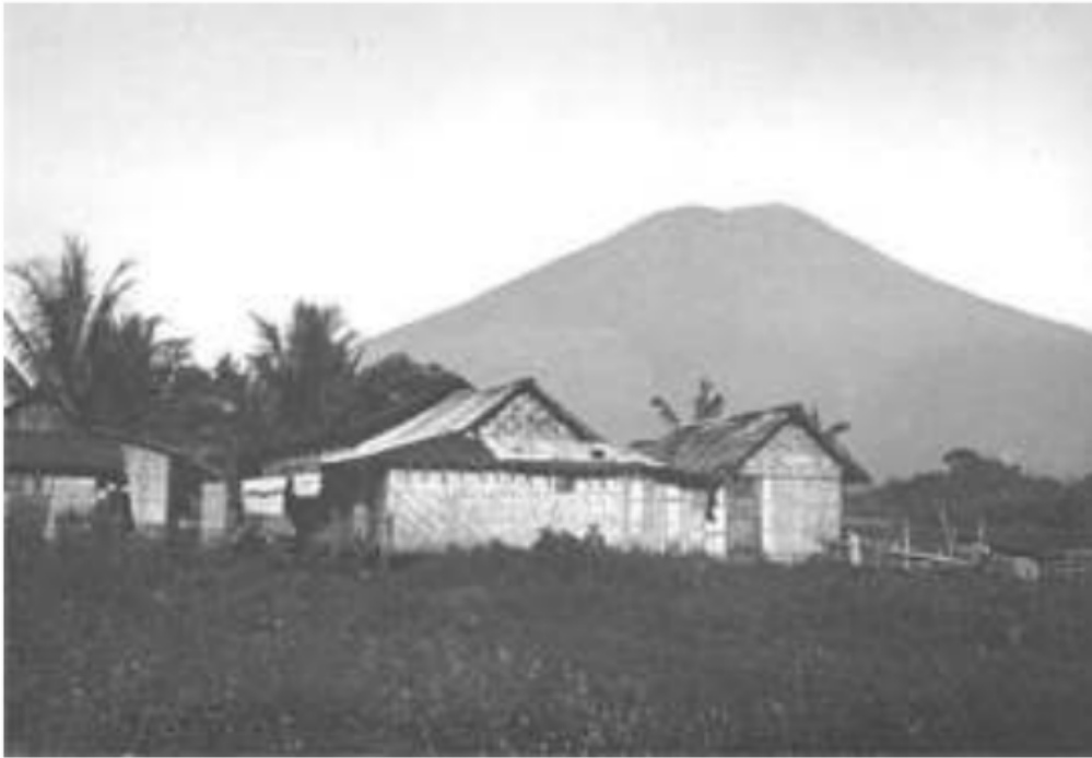
Gambar 23. Gunung Dempo di Onderafdeeling Pagaram, 1920. Tempat berasalnya suku Pasemah, Kikim, Gumay, Lintang, Enim, Semendo, Kisam atau orang-orang yang menggolongkan diri Jagad Basemah.

tengah Bukit Barisan pada Keresidenan Palembang, yang terletak Onderafdeeling Pagaram 13 , dari gunung ini berasal mata air sungai Ogan di sebelah selatannya, sungai Lematang di sebelah utaranya, sungai Lematang memiliki anak-anak sungai lainnya, seperti sungai Kikim, Lintang, Mulak, Kundur, Dendan, dan Enim. dari Gunung Dempo ini turun orang-orang dan suku Pasemah, Lintang, Kikim, Semendo, Enim, Lingsing dan Ogan. Orang Pasemah melewati aliran sungai Lematang, sementara orang Ogan menelusuri sungai Ogan, di mana pertemuan sungai Ogan dan sungai Lematang mengalir sungai Enim yang menurunkan Suku Enim, campuran antara suku Lematang dan Ogan. Di antara pertemuan sungai Lematang dan Musi terdapat Suku Musi bagian tengah atau orang Belida.