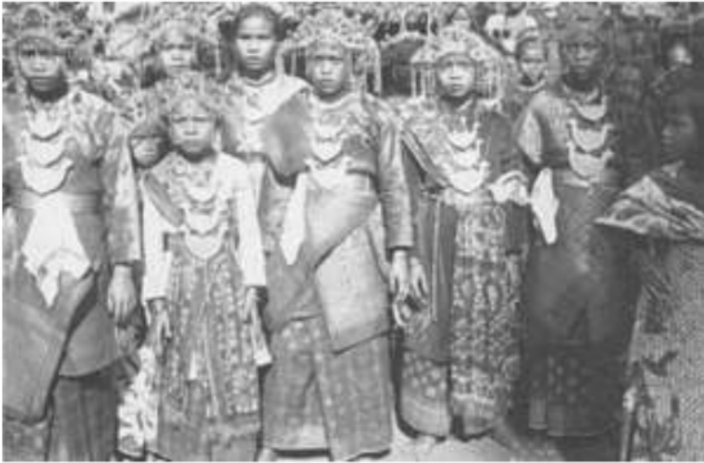
Gambar 31. Gadis-gadis uluan di Muara Enim dengan pakaian adatnya, 1925

Pada dasarnya, kelima suku tersebut mendiami tepian sungai Lematang. Sungai Lematang memiliki anak sungai yakni sungai Enim, sungai Penukal dan berakhir alirannya di sungai Belida yang merupakan perbatasan langsung dengan sungai Musi. Suku Belida dan daerahnya memiliki kesamaan dengan suku Ogan Pegagan di Onderafdeeling Ogan Ilir yang dimasukkan sebagai daerah kepungutan pada zaman Kesultanan Palembang.