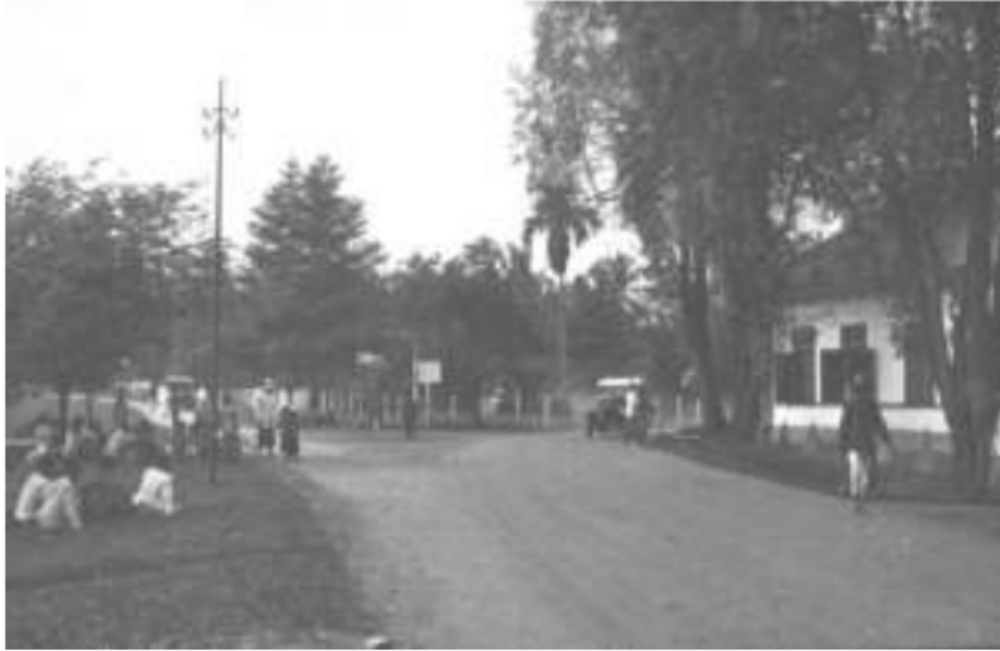
Gambar 18. Keadaan jalan di Muara Enim tahun 1921. Gambaran mulai munculnya kemakmuran uluan.

ketinggian 1000 meter dari permukaan laut. Pada awalnya kopi Robusta mencoba menggantikan posisi kopi jenis Arabica dan ditanam di daerah Basemah di Onderafdeeling Pagaralam, Semendo di Onderafdeeling Lematang Hilir Muara Enim, dan Ampat Lawang di Onderafdeeling Lematang Hulu Lahat.