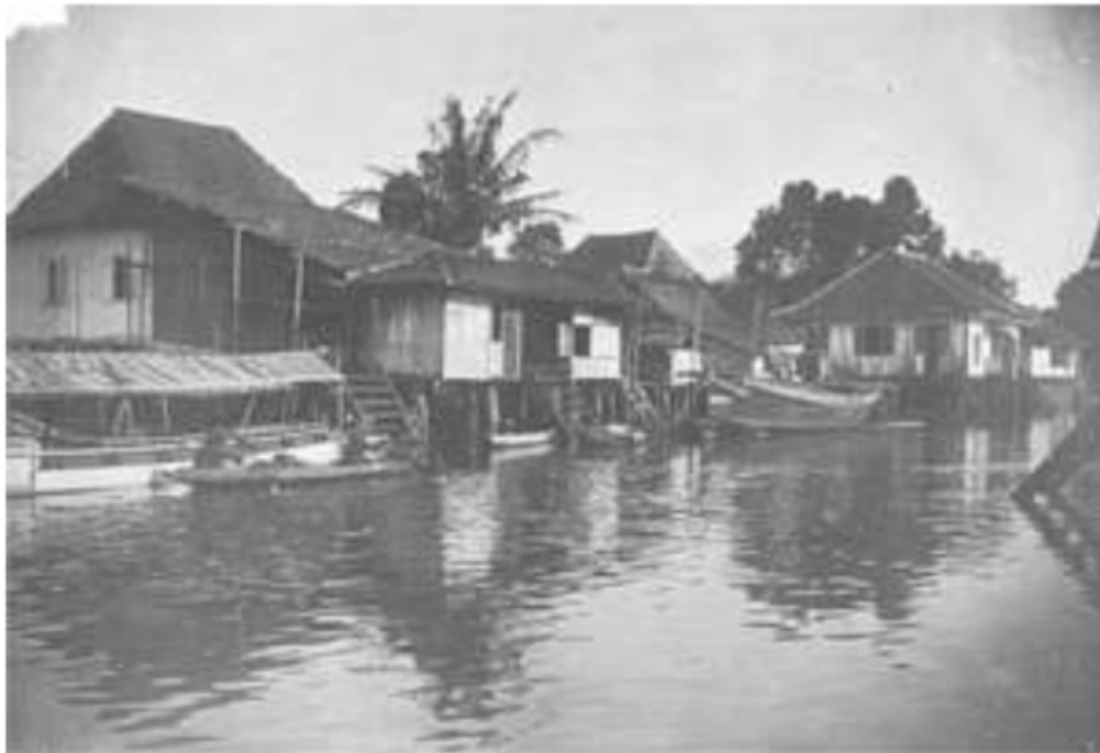
Gambar 10. rumah-rumah di Kota Palembang yang menghadap sungai. Sungai urat nadi utama transportasi kota, 1900.

Hasil kebun ini dibeli oleh para kaki tangan raja dengan harga yang murah, sebaliknya orang iliran kembali menjual berbagai keperluan pedalaman seperti candu, garam dan bahan pakaian kepada masyarakat ulu . Gambaran yang datang dari Marsden, bahwa kota ini terletak beberapa mil di atas delta sungai atau sekitar 60 mil dari laut dengan deskripsi pada masa kesultanan sebagai berikut, Palembang selalu digenangi air sungai, terutama ketika air pasang sehingga tidak memungkinkan