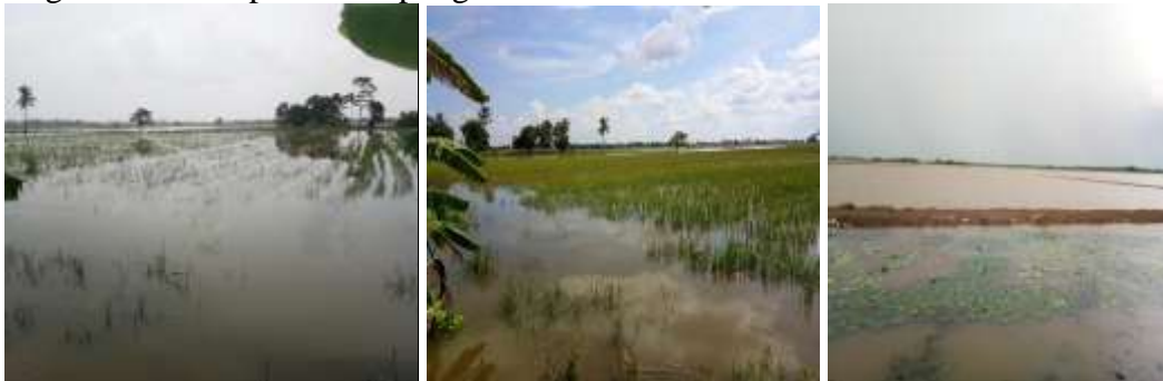
Gambar 2. Kondisi Eksisting Lahan Rawa Lebak

Penggunaan pompa untuk mengalirkan air dari sungai ke lahan juga tidak semua bisa dilakukan oleh petani. Hal ini disebabkan oleh besarnya biaya yang diperlukan untuk menyiapkan peralatan seperti pompa, tenaga listrik, pipa atau selang, terutama petani yang memiliki lahan yang jauh dari sungai. Berkurangnya debit sungai akibat kekeringan yang mengakibatkan sulitnya mendapatkan air dan perlu tenaga pompa yang berkapasitas tinggi untuk mengalirkan air. Pengelolaan air dengan menggunakan pompa biasanya digunakan oleh petani pemilik lahan berada dekat dengan sungai. Biaya yang digunakan untuk pengadaan peralatan tidak terlalu besar. Pengelolaan air periode musim hujan merupakan hal tersulit yang dihadapi oleh petani, kegiatan pertanian tidak dilaksanakan sama sekali akibat lahan tergenang air sampai kedalaman diatas 100 cm. Usaha yang pernah dilakukan adalah dengan menutup pintu air dan membuang air ke sungai namun tidak berhasil sebab tinggi genangan sama dengan tinggi air sungai, sehingga sungai tidak mampu menampung air berlebih.