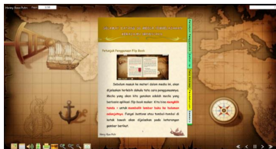
Gambar 2. Tampilan Bahan Ajar

Pada tahap development (pengembangan), peneliti melaksanakan pengembangan buku digital Kerajaan Sriwijaya dengan menggunakan aplikasi flip book maker . Kemudian dilakukan expert review .