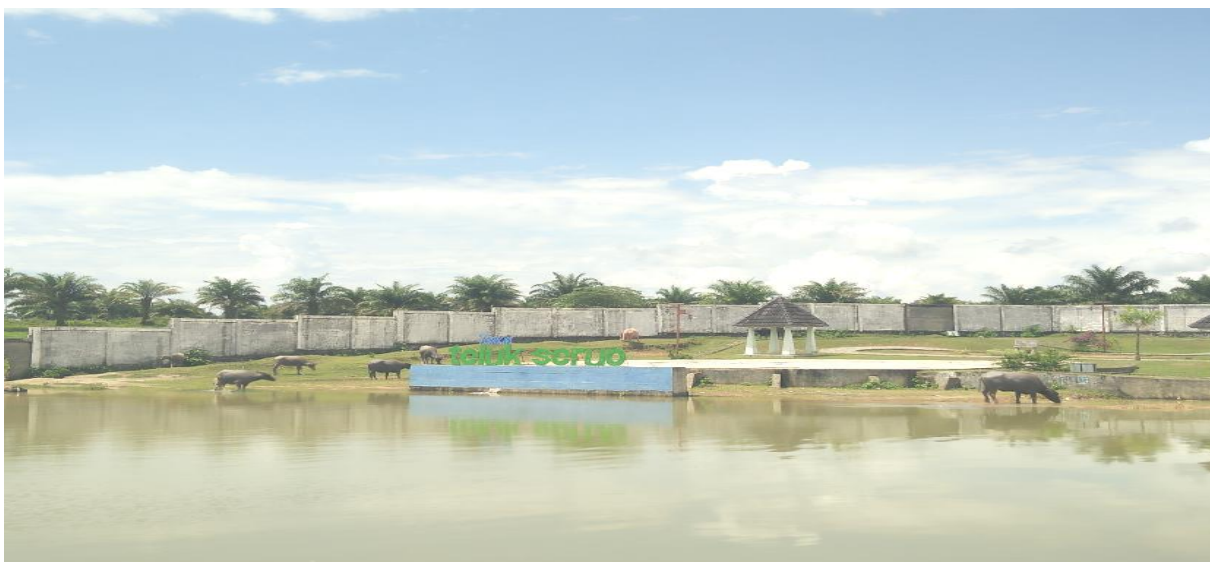
Gambar 1. Danau Teluk Seruo

Olahraga dan Pariwisata kabupaten Ogan Ilir perlu melakukan promosi wisata serta yang terpenting adalah melakukan pembangunan dan perbaikan sarana prasarana beberapa objek wisata di Kabupaten Ogan Ilir yang terdata sebagai objek wisata dengan data yang terdiri dari 16 jenis objek wisata, 9 jenis wisata kerajinan khas Ogan Ilir, 48 wisata cagar budaya kepurbakalaan Kabupaten Ogan Ilir, berbagai warisan budaya tak benda khas Ogan Ilir lainnya. Dari total 16 objek wisata yang terdata di kantor Dinas Pemuda Olahraga dan Pariwisata kabupaten Ogan Ilir, dan masih banyaknya objek wisata yang dikatakan jauh dari standarisasi kelayakan sebagai daya untuk menarik wisatawan, baik objek wisata yang dalam pengembangan maupun yang belum dikelola oleh pemerintah.