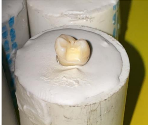
1. Preparasi sampel