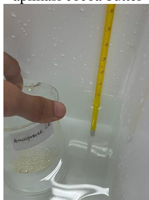
5. Thermocycling pada suhu 5°C