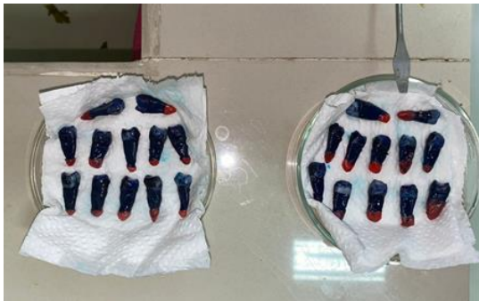
8. Hasil perendaman methylene blue selama 24 jam