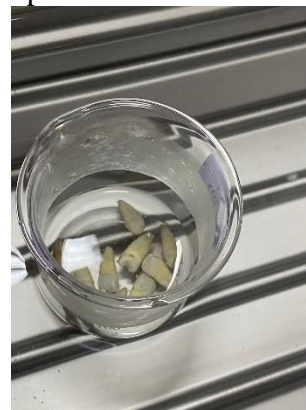
4. Thermocycling pada suhu 55°C