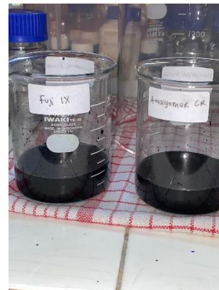
7. Sampel direndam methylene blue selama 24 jam