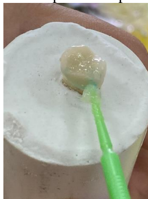
3. Restorasi dilanjutkan dengan aplikasi cocoa butter