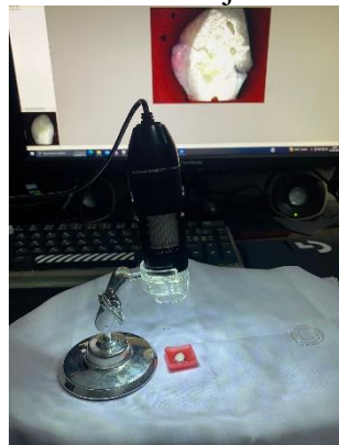
10. Pengamatan kebocoran mikro dengan USB digital microscope