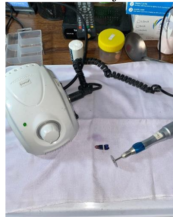
9. Pemotongan gigi menggunakan separating disc