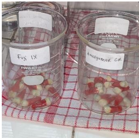
6. Persiapan perendaman methylene blue