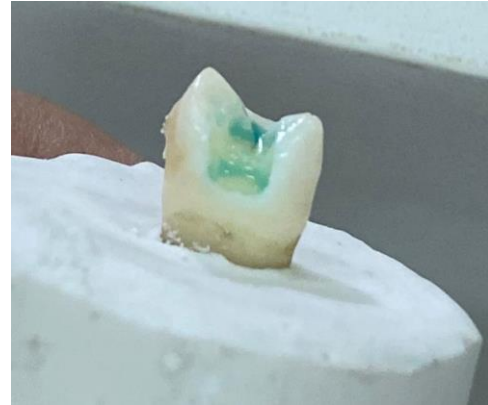
2. Aplikasi dentin conditioner