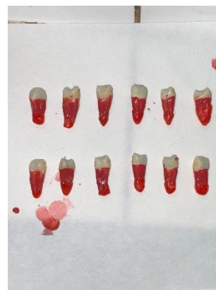
6. Foramen apikal ditutup dengan wax dan akar dilapisi dengan cat kuku