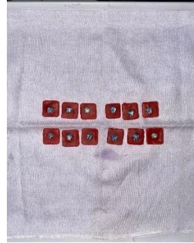
12. Hasil sampel kelompok GIC