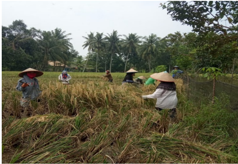
Gambar 1.1 Aktivitas Buruh Tani