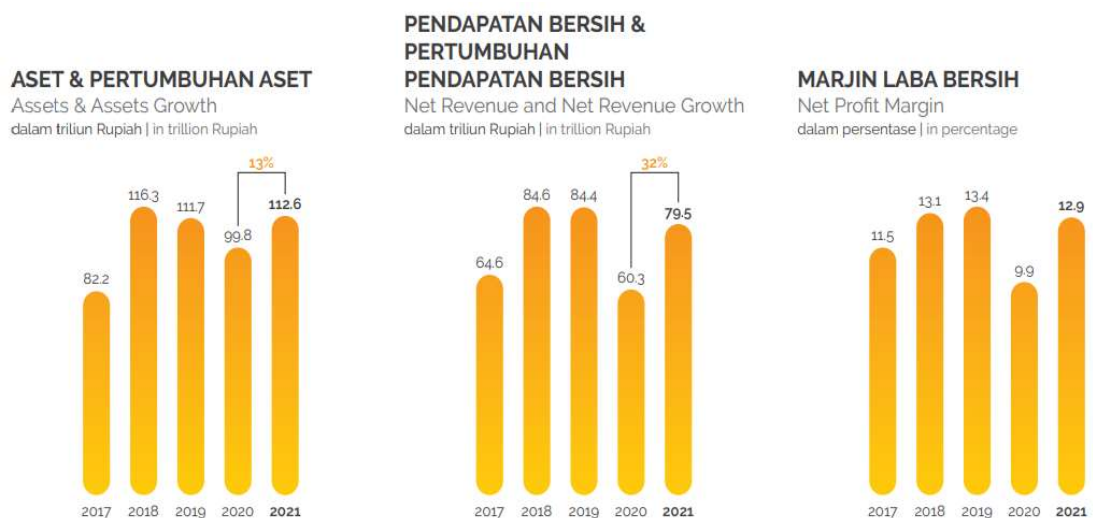
Gambar 1.1 Produktivitas PT United Tractor Palembang 2017-2021

Pada pengukuran yang dilakukan tahun 2021, tingkat produktivitas karyawan UT berada pada kategori Best Productive . Employee Engagement Survey (EES) untuk mengevaluasi program sumber daya manusia dan mendengarkan umpan balik dari karyawan sebagai peluang untuk perbaikan. EES tahun 2021 memberikan tingkat keterikatan sebesar 79,3% (Laporan Manajemen United Tractor, 2021).