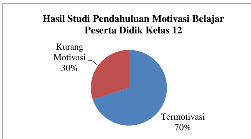
Gambar 1 Data Awal Motivasi Belajar Mata Pelajaran Akuntansi Kelas 12

Hasil pengamatan dan interaksi langsung peneliti dengan pendidik akuntansi, Ibu Liza, S.Pd, menunjukkan bahwa sebagian besar peserta didik masih menghadapi tantangan dalam memahami materi akuntansi. Data hasil belajar peserta didik kelas XII dalam pelajaran akuntansi menunjukkan bahwa dari keseluruhan 96 peserta didik, sekitar 60% dari mereka belum mencapai ambang batas kelulusan minimal (KKM) sebesar 60%, sementara 40% telah melewatinya. Standar KKM yang ditetapkan adalah sebesar 70. Di samping itu, peneliti juga menjalankan studi pendahuluan guna menilai tingkat motivasi peserta didik kelas XII di SMK Perbankan Alumnika Palembang. Pada tanggal 2 Oktober 2023, data tentang motivasi belajar dalam pelajaran akuntansi berhasil terhimpun, sebagaimana terlihat dalam Gambar 1.