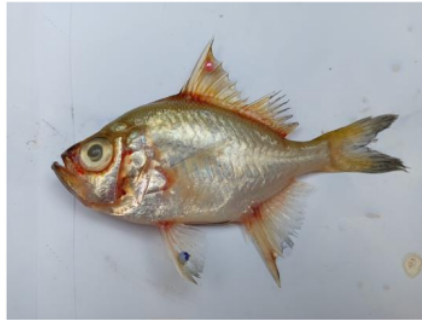
Gambar 1. Ikan sepengkah ( Parambassis wolffii ) asal Sungai Kelekar, Kabupaten Ogan Ilir, Sumatera Selatan

bubu pengilar dan jaring. Morfologi ikan sepengkah yang digunakan pada studi ini disajikan pada Gambar 1.